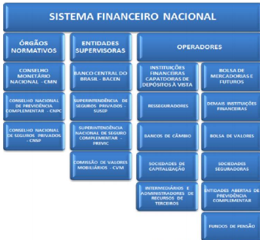
Figura 2 – Sistema Financeiro Nacional