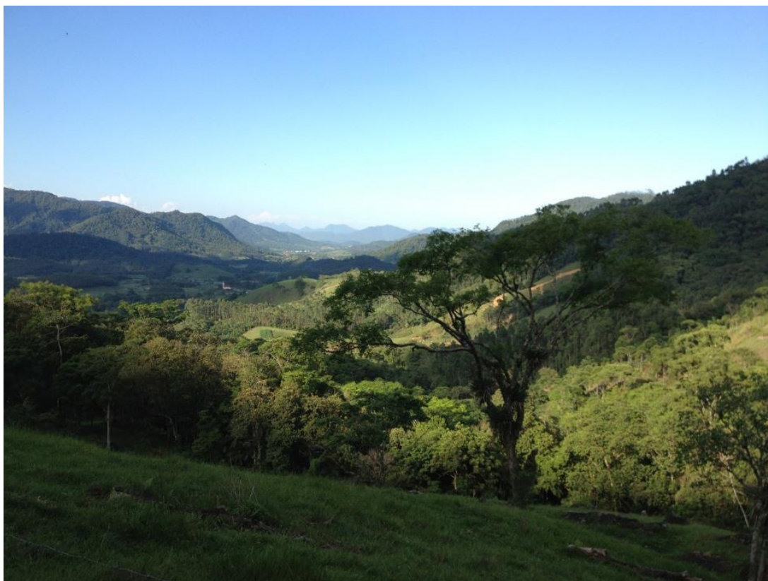
FIGURA 4. PAISAGEM LOCALIDADE RIO DA LUZ III, MACUCO PEQUENO.