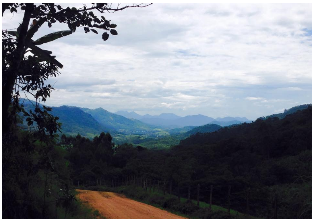
FIGURA 5. PAISAGEM RIO DA LUZ III, ANTIGA ESTRADA PARA POMERODE.