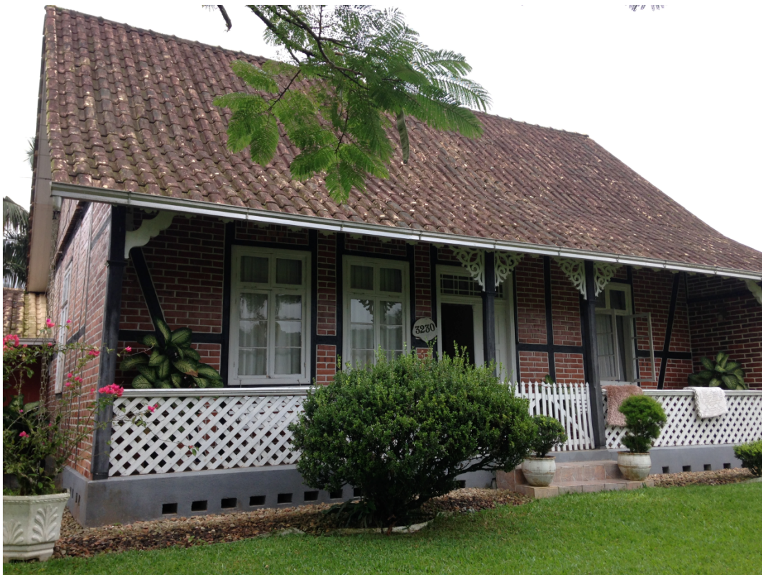
FIGURA 3. CARACTERÍSTICA DE UMA CASA EM PROPRIEDADE NA LOCALIDADE DE RIO DA LUZ I.

Algumas propriedades apresentam atrativos paisagísticos, outras apresentam atrativos culturais: casas enxaimel, os costumes, as roupas, as pessoas, o idioma, etc (Figura 3).