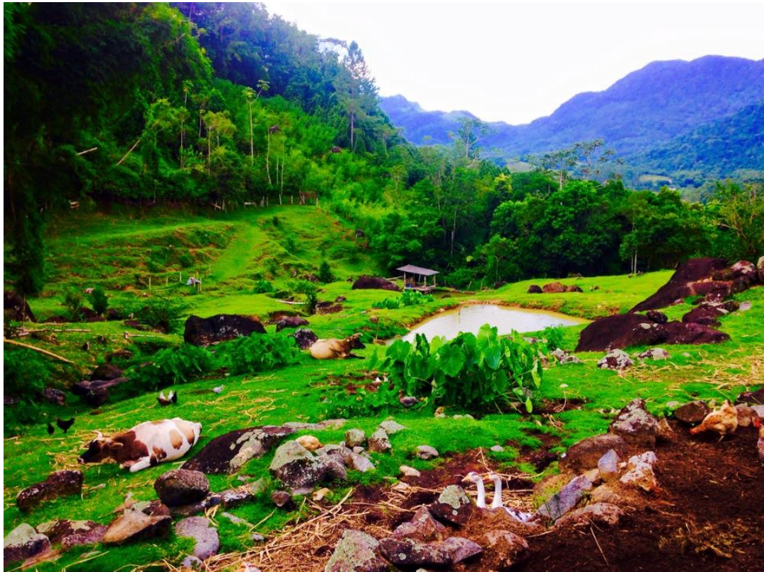
FIGURA 7. PAISAGEM DA LOCALIDADE RIO CERRO III.

Em cerca de 90% das propriedades verificadas existe a possibilidade de realização de degustação de produtos do campo. Cerca de 10% dos entrevistados produz algum tipo de artesanato.