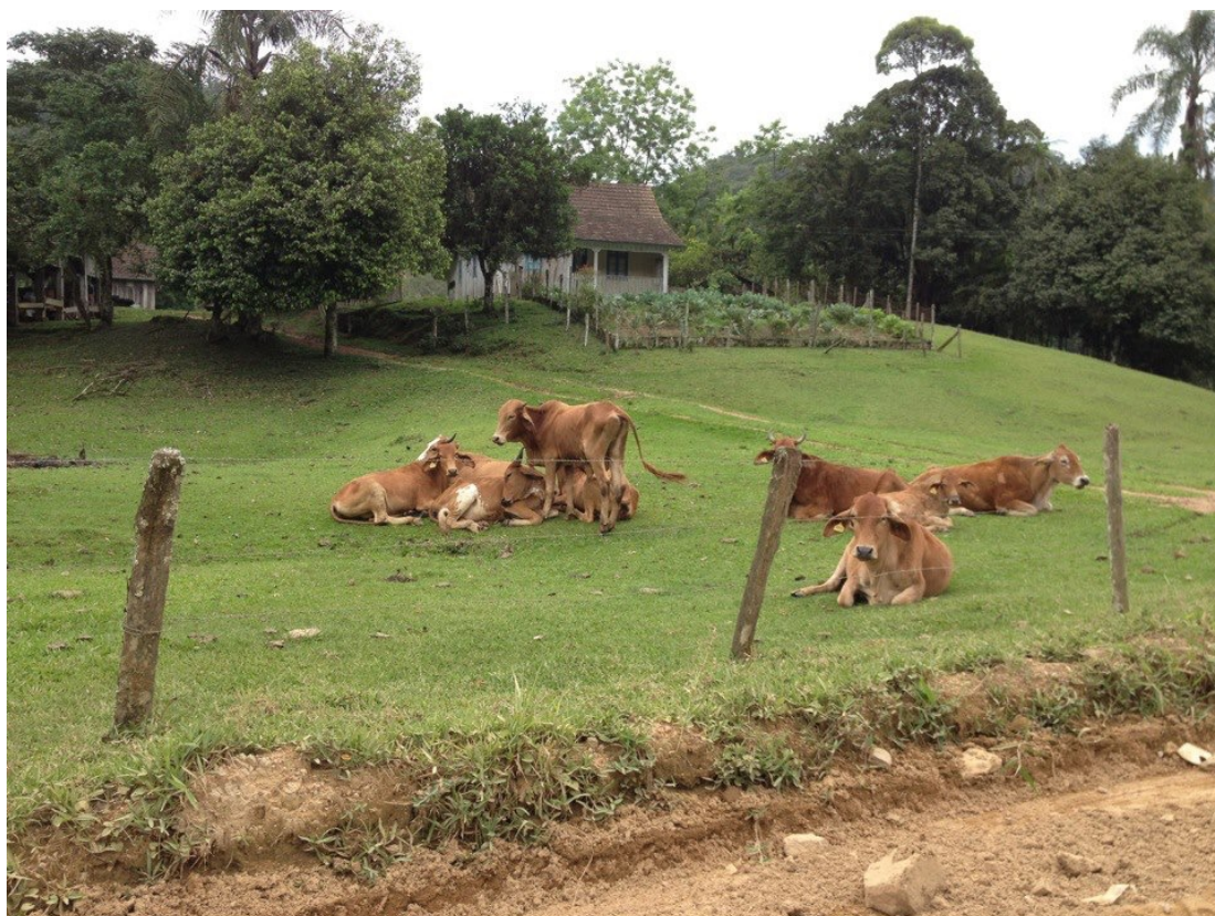
FIGURA 2. PAISAGEM DA LOCALIDADE GARIBALDI COM A CRIAÇÃO DE BOVINOS DE CORTE.