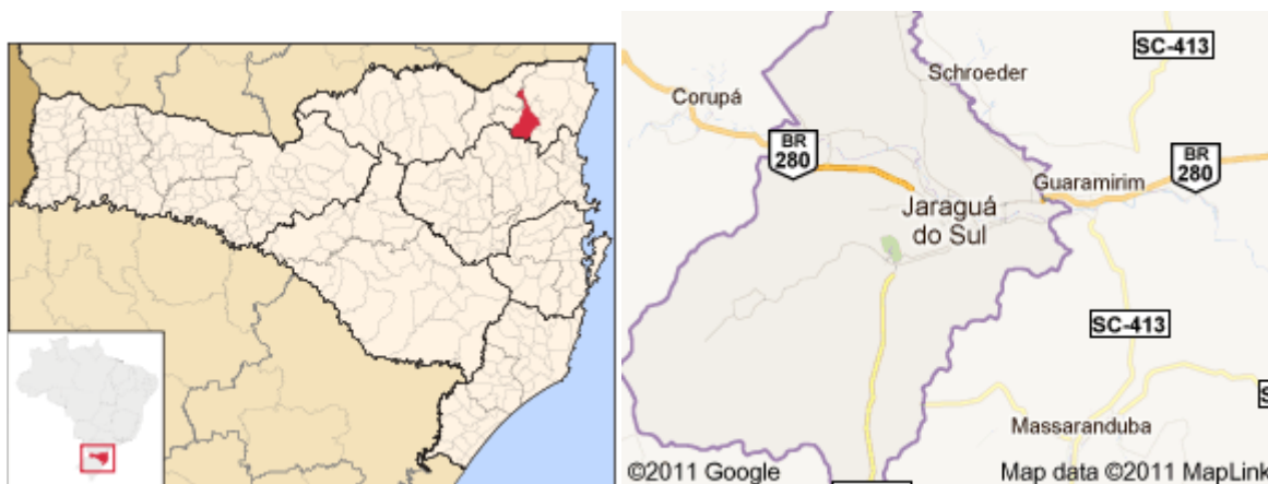
FIGURA 1. LOCALIZAÇÃO DE JARAGUÁ DO SUL NO ESTADO DE SANTA CATARINA.

Foi efetuada pesquisa através de questionário (Apêndice 1), realizada com propriedades em Jaraguá do Sul-SC a fim de caracterizar as propriedades em relação à aspectos relacionados à exploração do turismo rural. Jaraguá do Sul está localizada na região norte do Estado de Santa Catarina (Figura 1).