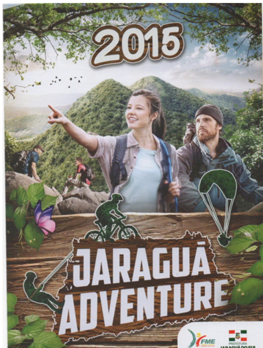
FIGURA 8. CARTAZ DO PROGRAMA JARAGUÁ ADVENTURE.

homem do campo e sua vida, bem como poderia ocorrer a degustação de comidas típicas e venda de produtos.