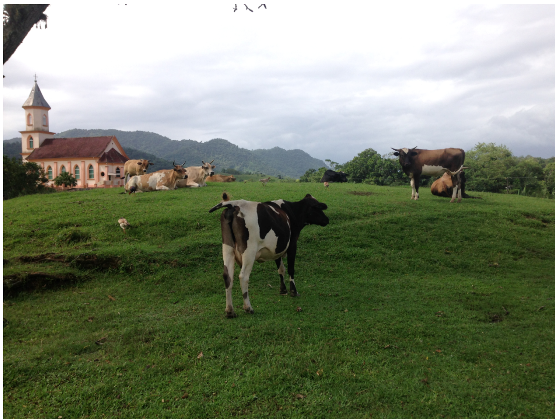
FIGURA 6. PAISAGEM DA LOCALIDADE DE RIO DA LUZ III, CRIAÇÃO DE BOVINOS EM SISTEMA EXTENSIVO.

O homem do campo e sua vida, seus costumes, traduz-se na maior riqueza a ser usufruída quando o turismo rural é estabelecido.