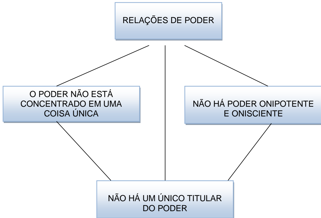
FIGURA 1 – RELAÇÕES DE PODER

Observa-se na figura mencionada acima, que o poder não está concentrado nas mãos de um único sujeito, ele está espalhado por todas as camadas da sociedade, sendo percebido a partir de relações de poder que são exercidas em diferentes níveis: local, regional e familiar.