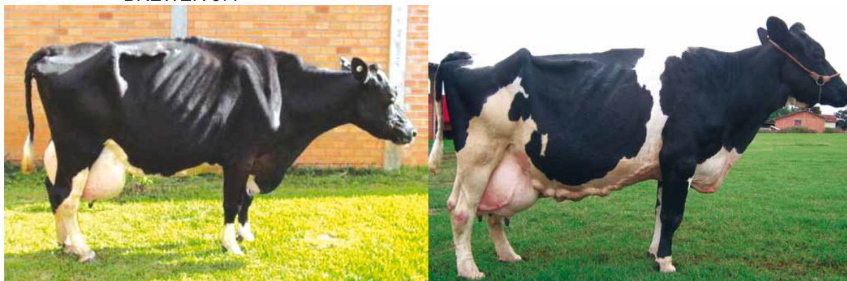
FIGURA 1 - VACAS VITALÍCIAS: PRIMEIRA COLOCADA 2015 V.D.V. SABINA MEADOWLORD E SEGUNDA COLOCADA 2015 E.B.E. JAQUELINE BREWER 377