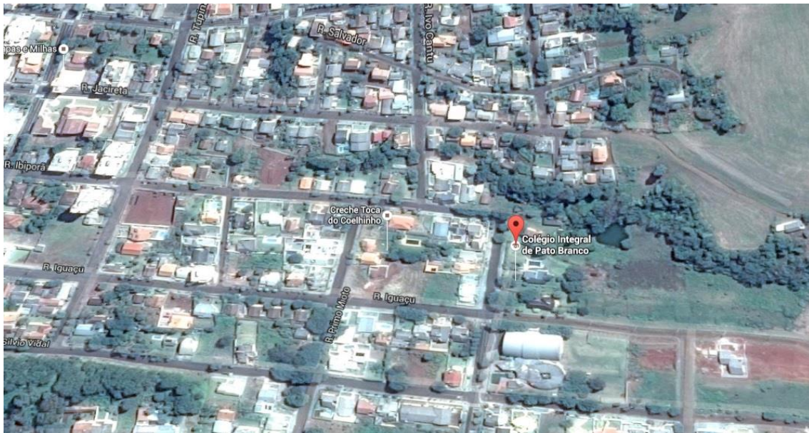
IMAGEM 1 – LOCALIZAÇÃO DA ESCOLA INTEGRAL

O trabalho foi realizado na Escola Integral, localizada na cidade de Pato Branco, no estado do Paraná. A escola atualmente possui um total de 367 estudantes, sendo 164 no período matutino (5º ao 9º ano do Ensino Fundamental) e 203 no período vespertino (Educação Infantil ao 4º ano do Ensino Fundamental), além de 59 colaboradores. Sua infraestrutura é composta por 12 Salas de Aulas, um Laboratório de Ciências, Secretaria, Sala de Coordenação, Ginásio e dez Banheiros. A Sala dos Professores e a Biblioteca foram adaptadas em um contêiner no espaço físico externo. Os estudantes também fazem uso de um parque ao ar livre e uma horta.