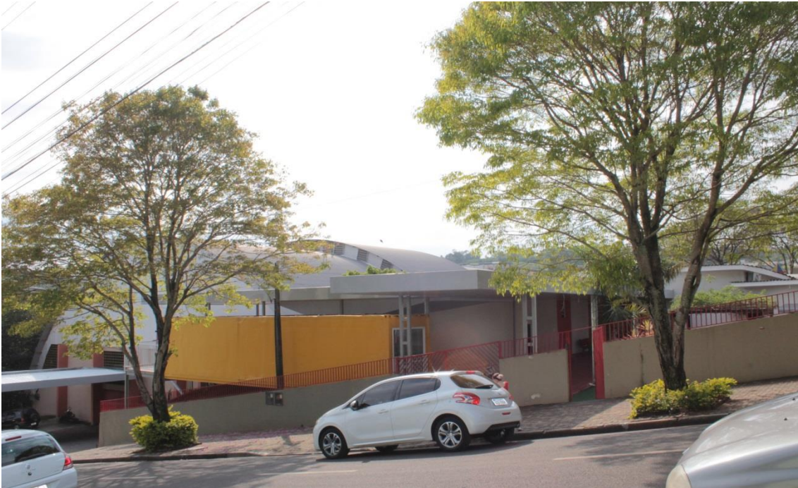
IMAGEM 2 – VISÃO FRONTAL DA ESCOLA INTEGRAL