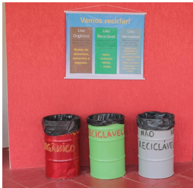
IMAGEM 3 – LIXEIRAS PARA SEPARAÇÃO DE RESÍDUOS

No terceiro momento, através dos dados obtidos iniciou-se a educação ambiental, a princípio foram inseridas três lixeiras com um banner autoexplicativo (IMAGEM 3 e 4) no pátio principal da escola, sendo um orgânico, um reciclável e outro não reciclável. Esses recipientes de coleta foram feitos através do reaproveitamento de tambores de 200 litros que são descartados por uma indústria de embalagens.