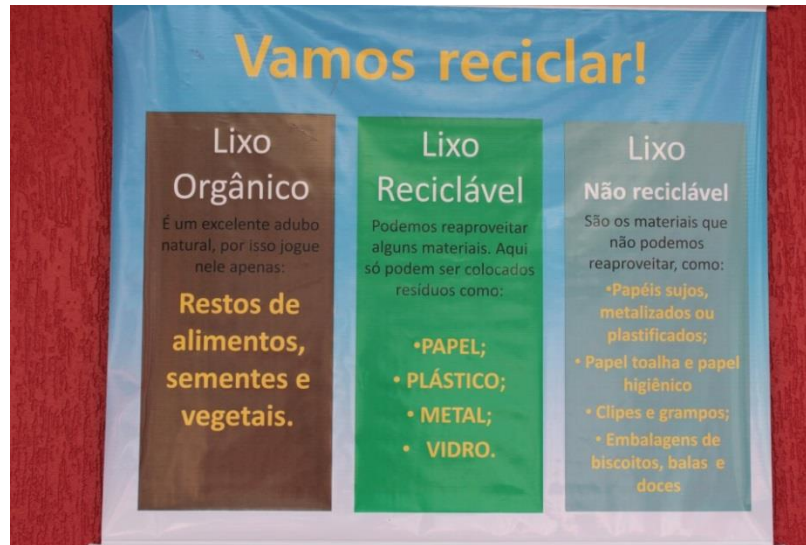
IMAGEM 4 – BANNER AUTOEXPLICATIVO

Nas salas de aulas foram colocadas duas lixeiras com folder explicativo, sendo uma para resíduos recicláveis e outra para não reciclável, pois o consumo que gera os resíduos orgânicos é administrado pelas professoras regentes que fazem o descarte na lixeira específica no pátio. Após esse primeiro contatos com os estudantes e os colaboradores da escola, foram realizadas palestras destinadas a todos em sala de aula. Nestas palestras foi explicada a definição de resíduos, a especificação dos resíduos produzidos na escola, a importância da destinação correta, onde deveria ser colocado o resíduo produzido, informações gerais sobre a separação, além de algumas curiosidades e como os resíduos da cidade são manejados.