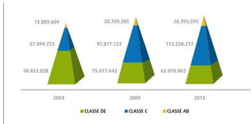
FIGURA 2: PIRÂMIDE POPULACIONAL E CLASSES ECONÔMICAS