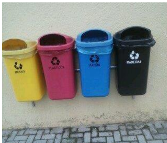
FIGURA 13: LIXEIRAS PARA COLETA SELETIVA NOVAS