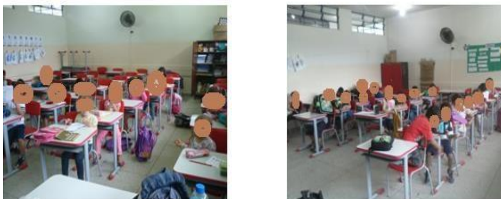
FIGURA 10: SALAS DESORGANIZADAS