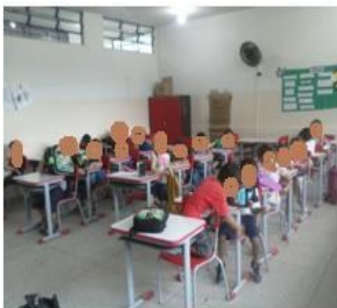
FIGURA 6: SALA DE AULA ORGANIZADA