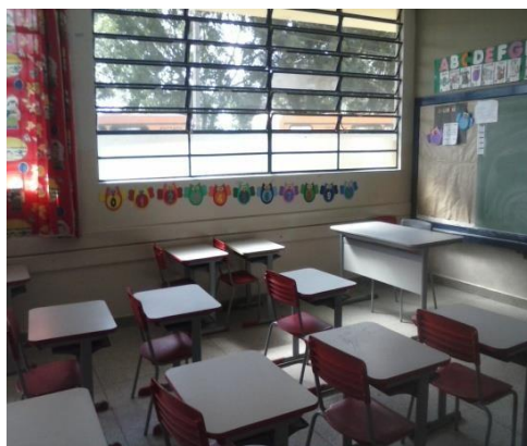
FIGURA 5: SALA DE AULA ARRUMADA LOGO APÓS A AULA