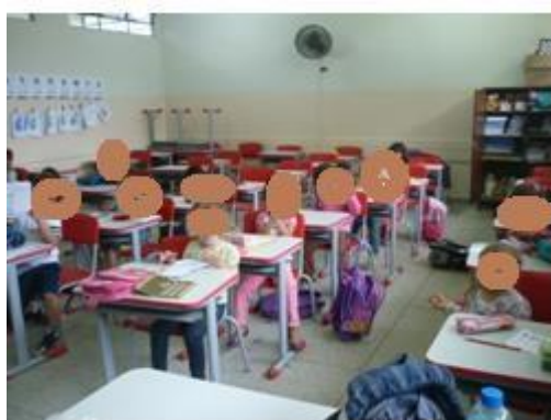
FIGURA 4: SALA ANTES DESORGANIZADA