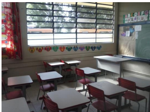
FIGURA 16: SALA ORGANIZADA APÓS REALIZAÇÃO DO PROJETO