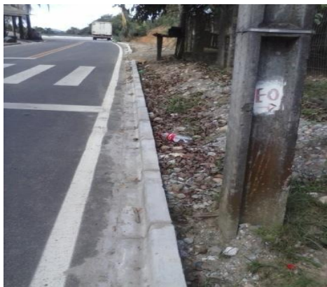
FIGURA 12: RUA AO LADO DA ESCOLA