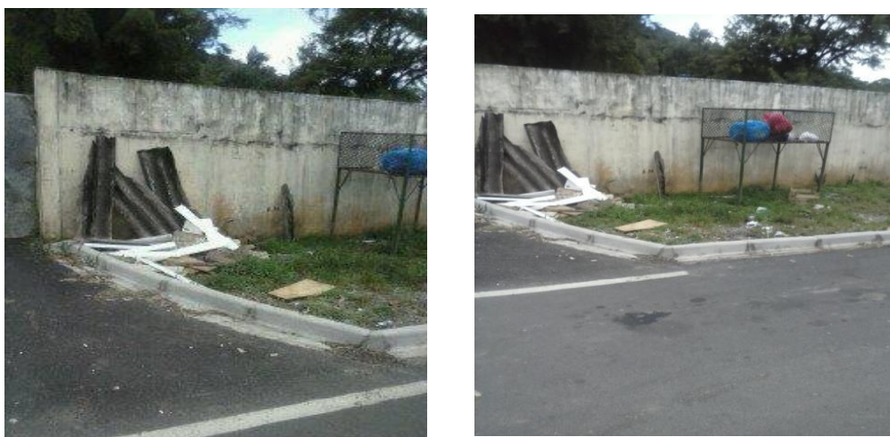
FIGURA 11: MURO DA ESCOLA E LIXEIRA DO LADO DE FORA

Além disso, foi realizado um passeio pelo entorno da escola para verificar se essa situação era assim também fora dos muros. Muitas situações foram registradas em imagens para que, posteriormente, fossem utilizadas nas discussões em sala de aula, procurando fazer com que as crianças percebessem que não adianta cuidar somente da escola mas também do seu bairro e de sua comunidade.