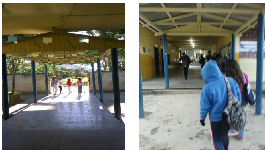
FIGURA 1: ENTRADA DA ESCOLA