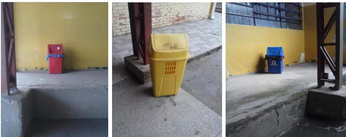
FIGURA 8: LIXEIRAS ESPALHADAS PELA ESCOLA