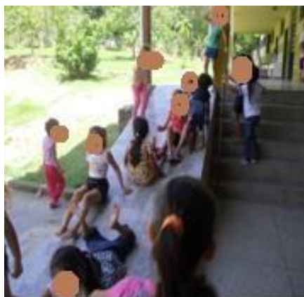
FIGURA 7: PÁTIO LIMPO PARA AS CRIANÇAS BRINCAREM