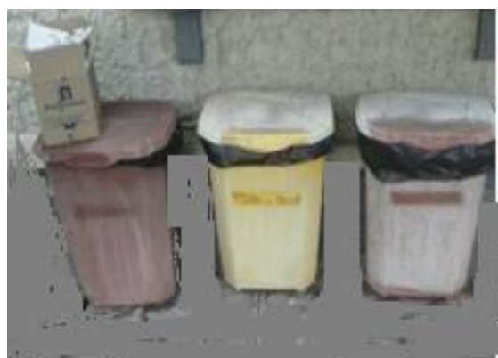
FIGURA 9: LIXEIRAS VELHAS E SEM USO