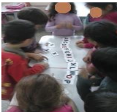
FIGURA 2: GINCANA COM OS ALUNOS