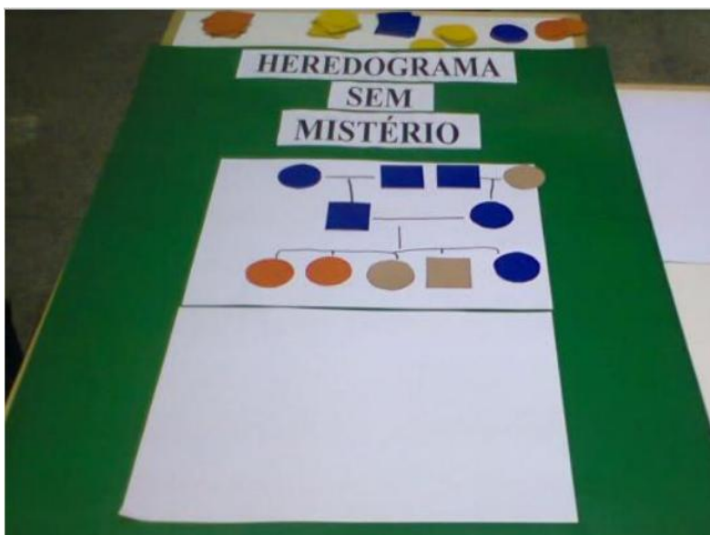
Figura 5: Tabuleiro do jogo “heredograma sem mistérios”.

Após a aplicação com os alunos, oitenta e cinco por cento responderam ser alterações que ocorrem no número de cromossomos, outros dez por cento responderam ser alterações nas células, e cinco por cento não quiseram responder.