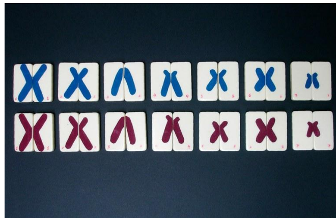
FIGURA 1: UNIÃO DAS CROMÁTIDES A PARTIR DE PEÇAS DE DOMINÓ.