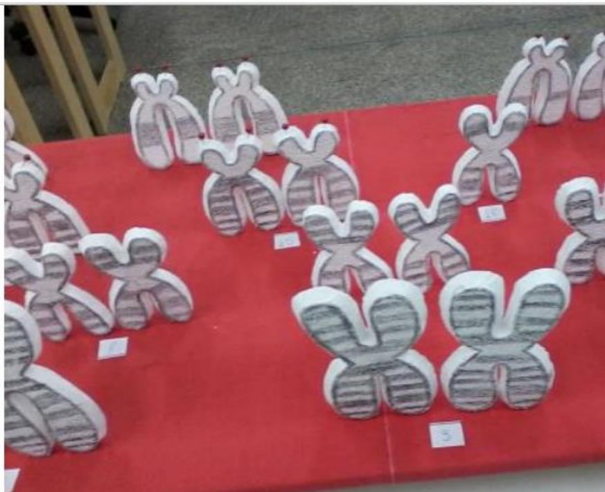
Figura 6: Tabuleiro com o cariótipo humano.

Disponível: http://www.scientia.ufam.edu.br/attachments/article/29/v3%20n1%2053-57%202014.pdf