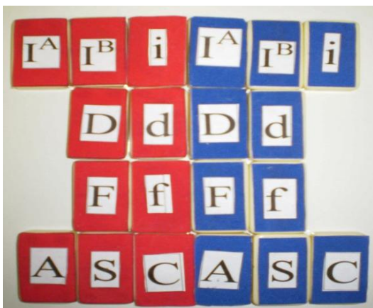
FIGURA 2: UNIÃO DE ALELOS, A PARTIR DE PECAS DE DOMINÓ.

O uso de modelos e o desenvolvimento de atividades lúdicas servem de auxílio para o professor despertar o interesse dos alunos pela matéria de genética, já que a visualização se torna mais fácil, de modo que os alunos podem interagir com o material. O presente trabalho baseou-se em uma pesquisa sobre jogos didáticos relativos ao tema genética, e seus resultados de acordo com a aplicação em sala de aula.