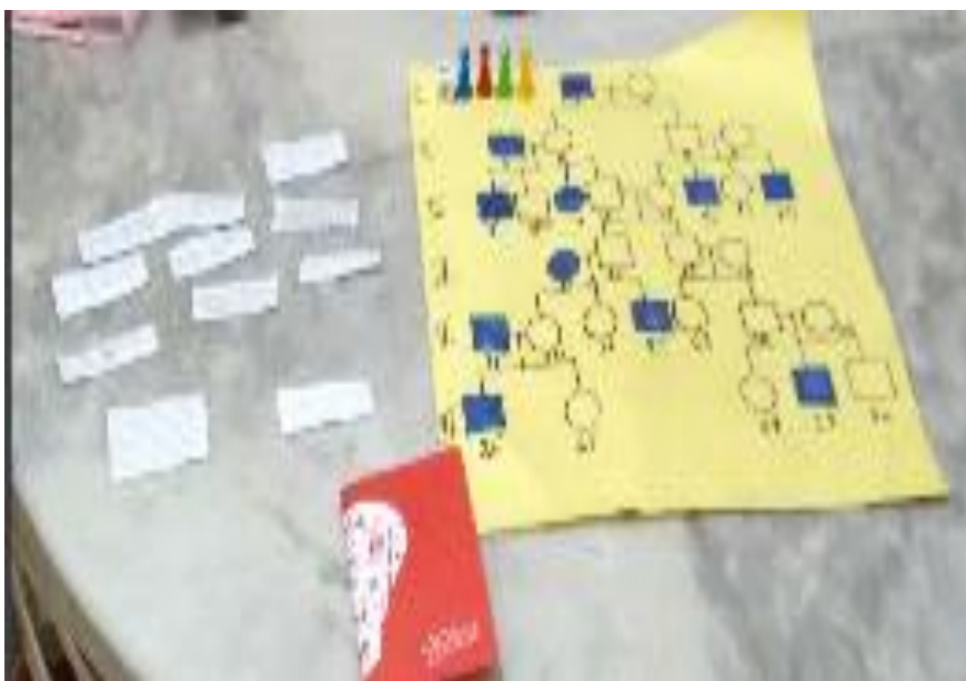
Figura 4: Foto do tabuleiro a ser desenvolvido pelos alunos, tirada de frente. Incluindo as peças, as cartas, o caderno de respostas e os papéis para os jogadores assinalarem as respostas ao longo do jogo.

Figura 3: Tabuleiro a ser desenvolvido pelos alunos incluindo as peças, as cartas, o caderno de respostas e os papéis para os jogadores assinalarem as respostas ao longo do jogo.