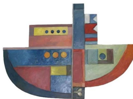
FIGURA 4- ARGONAUTAS.

Todas estas experiências técnicas como os formatos do suporte da pintura, as técnicas de empastes, e as assemblages influenciaram a construção da série “O mar não tá pra peixe!”, juntamente com as vivências, conceitos, e preocupações ecológicas do artista.