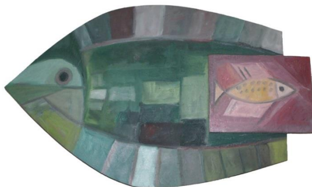
FIGURA 7

A aplicação de elementos construídos com materiais, a princípio incompatíveis, com o objetivo de criar uma tensão conceitual, encontra-se também na obra “Celacanto” (FIGURA 6), que é formada por dois elementos geométricos aproximados, um semicírculo construído em madeira e um retângulo confeccionado em resina de poliéster acrescida de uma carga de areia. Este conjunto tem como objetivo representar o peixe fóssil descoberto em 1932.