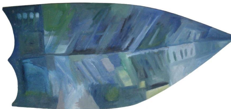
FIGURA 14

Na obra “Claustro” (FIGURA 13), realizada em cores prateadas e azuis, o desenho é sugerido na forma da obra e nos traços, em que as figuras surgem apenas na superfície oferecida pelo empaste, seres que se confundem ao disputar o mesmo espaço na embalagem, subvertendo o princípio da lei de Newton da impenetrabilidade da matéria.