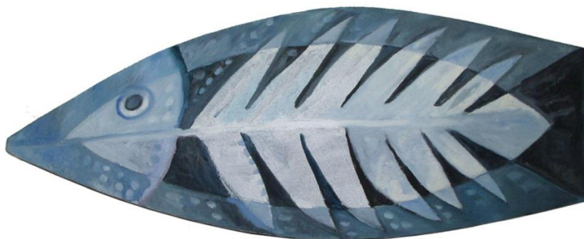
FIGURA 16 FONTE: O AUTOR

Em “O Dia seguinte” (FIGURA 15), realizado em cores monocromáticas, e recebendo incisões sobre o empaste acrílico, nos remete á uma situação irônica, onde um veículo da mídia após cumprir a função informativa, acaba como embalagem improvisada.