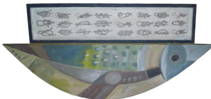
FIGURA 9

Em “Polímero”, (FIGURA 8), as formas do peixe surgem da junção de dois semicírculos que em sua parte superior onde um quadrado é introduzido e fornece um espaço para a inserção do polímero.