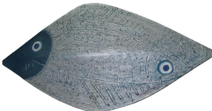
FIGURA 13

Na obra “Hg-80” (FIGURA 12), a cor azul predomina e uma linha prateada toma conta de toda a superfície, como uma contaminação, vai evoluindo numa ramificação crescente. Na tabela periódica dos elementos químicos Hg 80 é o símbolo do mercúrio, metal altamente poluente é largamente utilizado na lavra do ouro.