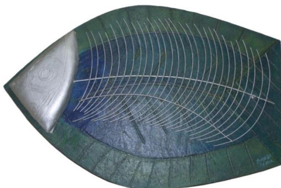
FIGURA 11

Na obra “Ikra” (FIGURA 10), realizada em forma de semicírculo, um elemento construído em resina de poliéster, do lado direito do suporte, se projeta para fora da superfície realizada em vários tons de azul.