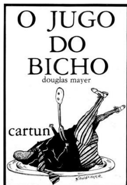
FIGURA 2- O JUGO DO BICHO/CAPA DO LIVRO

“Bicho, homem” de (1988), série que pertence ao acervo da prefeitura de Piracicaba, SP.