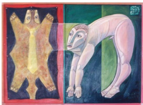
FIGURA 3- IMPRESSÕES.

acrescentar produtos de carga de origem orgânica, como é o caso da celulose. O resultado destas experiências foi ter conseguido vários tipos de massas que serviram a diversos propósitos e necessidades, dependendo do resultado esperado pela expressividade do tema. As fórmulas com base em óleo de linhaça começaram a ser usadas na série “Bicho, homem” (1988), evoluíram na série “Impressões” (1992), onde assumiu-se a técnica da assemblage . Na série “Argonautas” (2014), onde os barcos são a base das composições, usou-se a fórmula baseada em médium acrílico, e a resina de poliéster é incorporada nas experiências em busca de novas texturas.