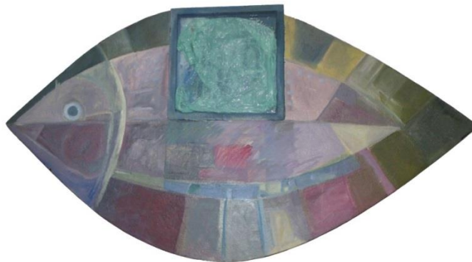
FIGURA 8