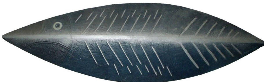
FIGURA 12