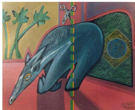
FIGURA 1- BICHO, HOMEM

A série “O mar não tá pra peixe!”, realizada em entre 2010 e 2015, denuncia a destruição dos ambientes aquáticos, elegendo o peixe como símbolo deste protesto. A ideia de trabalhar com este tema, surgiu da preocupação com a preservação do meio ambiente, e da constatação de que a pesca predatória, a poluição dos mares, e de outros mananciais aquáticos ameaçam de extinção várias espécies.