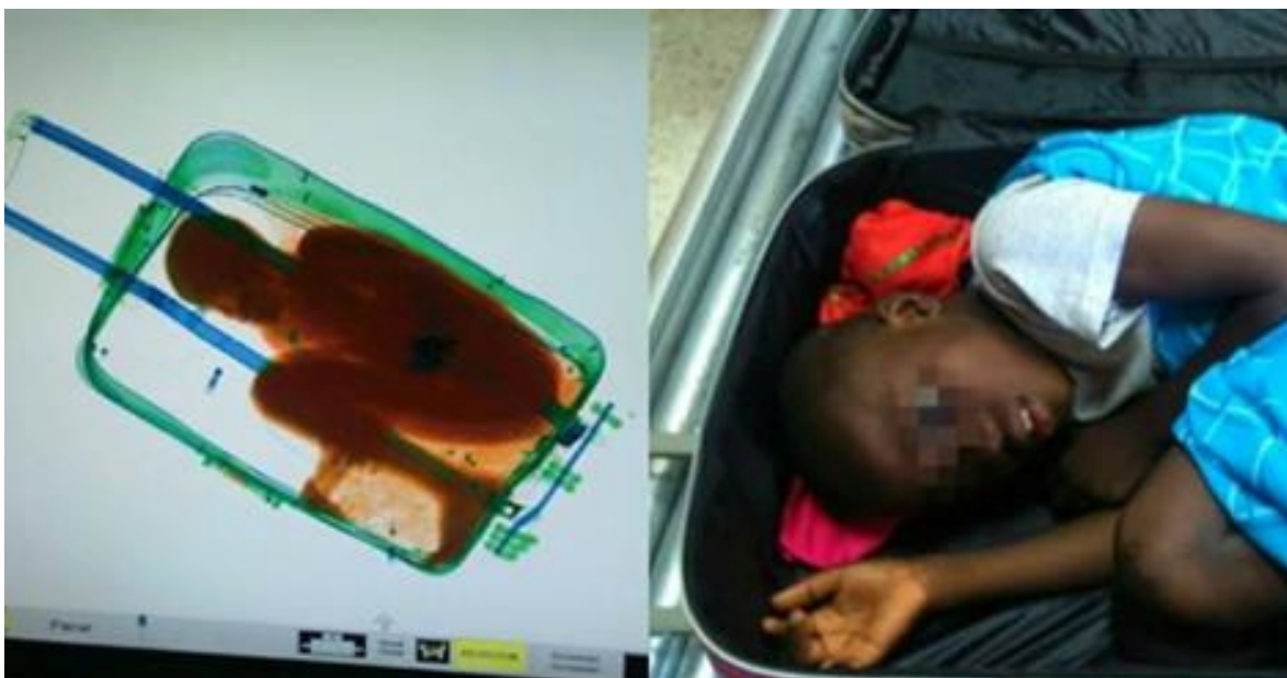
Figura 1 - Mulher tenta atravessar fronteira da Espanha com menino dentro de mala Estadão - 2015

Milhares de pessoas que cruzam enormes distâncias pelo deserto. Ou se aventuram em viagens marítimas, como no mar da Itália, fugindo da violência em seus países de origem, muitas vezes numa ida sem volta. Ou ainda quando estão com sorte e são resgatadas com vida, são expulsas e deportadas.