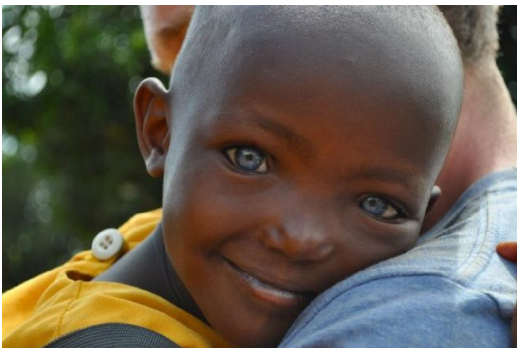
Figura 2 – Consciência Negra Brasil: 2012

Casos como este, mostram que não só os milhares de viajantes que embarcam por ano no país, rumo ao exterior, deveriam ter o conhecimento em Direitos Humanos. Mas, que qualquer cidadão deve conhecer os seus direitos fundamentais, assim como também os seus deveres. Isto é imprescindível para o exercício da cidadania, na luta em defesa dos Direitos Humanos.