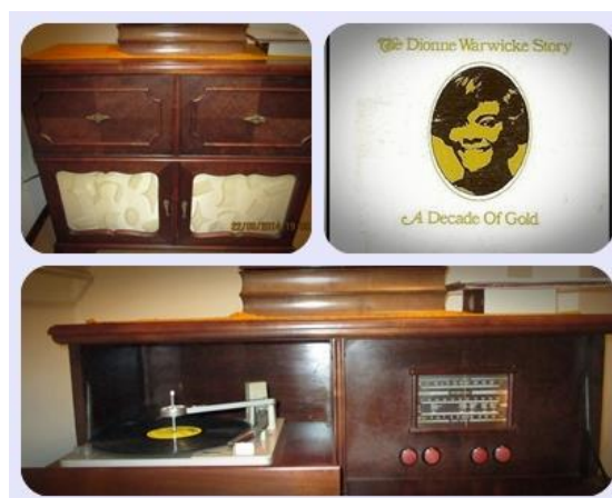
FIGURA 4 – VINIL E RADIOLA

f) I say a little prayer for you , interpretada por Dionne Warwick. A mídia vinil foi apresentada através de um vídeo pessoal, o qual mostra o funcionamento da radiola (Figura 4). Os alunos usaram seus dispositivos móveis para: assistir a um vídeo da cantora Dionne e pesquisar a letra. Tiveram a oportunidade de expressar, em inglês, sua opinião sobre a música com a ajuda de um material que contém vocabulário apropriado para tal requisito. ( Apêndice 4).