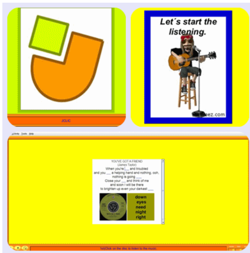
FIGURA 2 – JCLIC