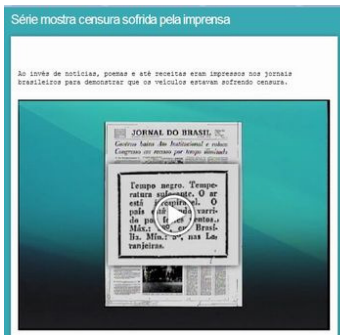
Figura 1: Vídeo, Série mostra censura sofrida pela imprensa.