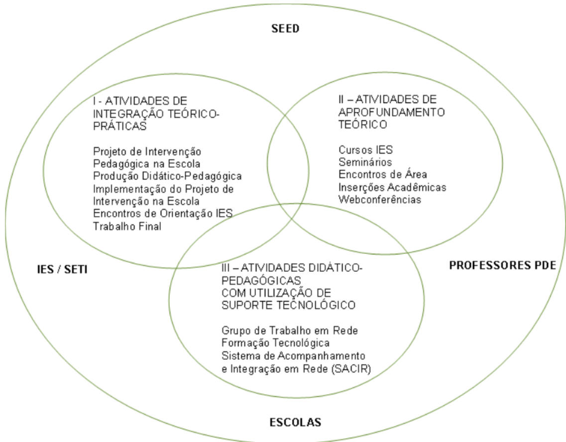
FIGURA 1- ORGANIZAÇÃO DA PROPOSTA DO PDE – PARANÁ