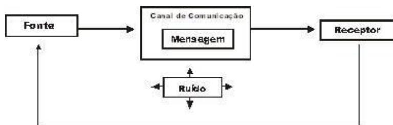
Figura 2. Modelo do fluxo da Comunicação 3 .

processo comunicacional é muito mais complexo, pois todo o processo de repasse de informação deve ser analisado criteriosamente principalmente com relação ao sentido e a interpretação que terá o receptor. Para tanto, os ruídos que são as interferências que a mensagem pode sofrer ao longo do caminho, são fatos importantes pelo fato de atingirem diretamente nas informações que podem influenciar na compreensão de um discurso.