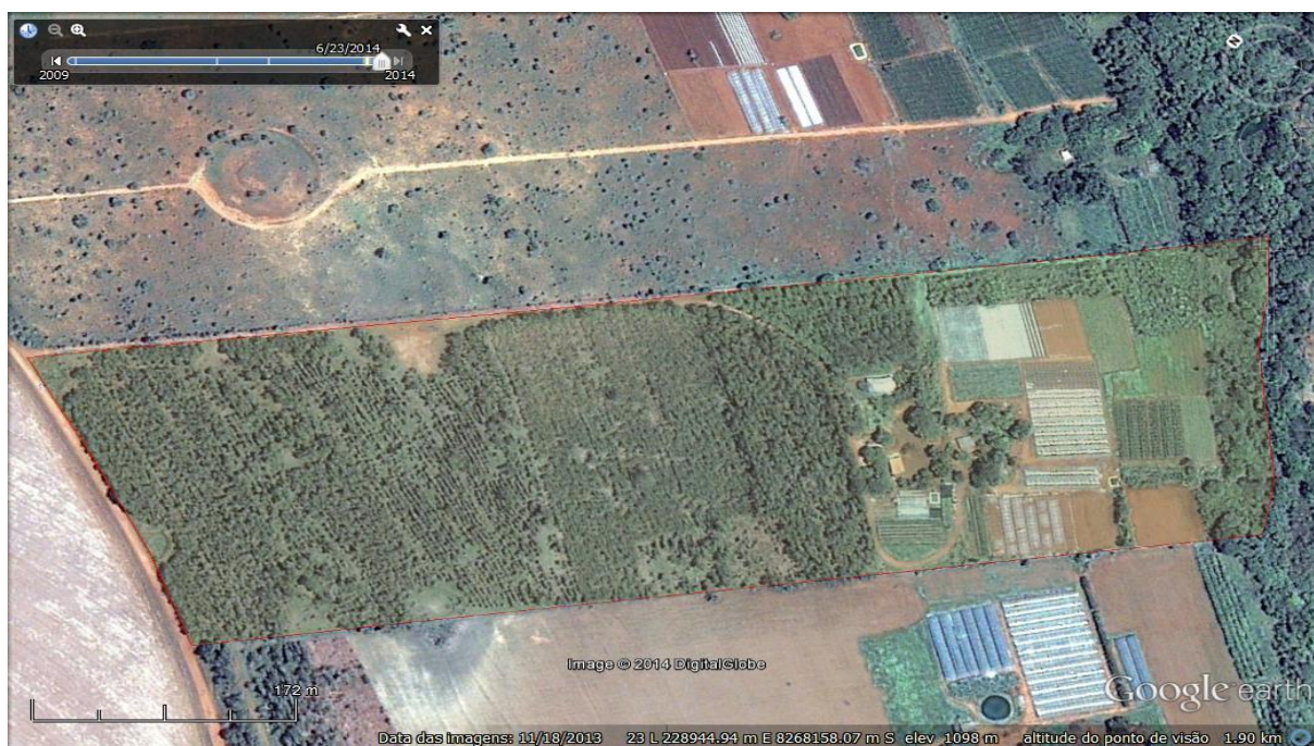
Figura 1 – Chácara Viveiro Germinar, localizada no N.R. Taquara, Planaltina/DF.

A propriedade em estudo desenvolve atividades de olericultura irrigada, produção de mudas de hortaliças, silvicultura com eucalipto ( Eucalyptus spp ) e tratamento artesanal e venda de madeira. Em propriedades vizinhas, por meio de contratos de parceria, o agricultor familiar Rogério Antônio complementa sua renda com silvicultura com a espécie já citada.