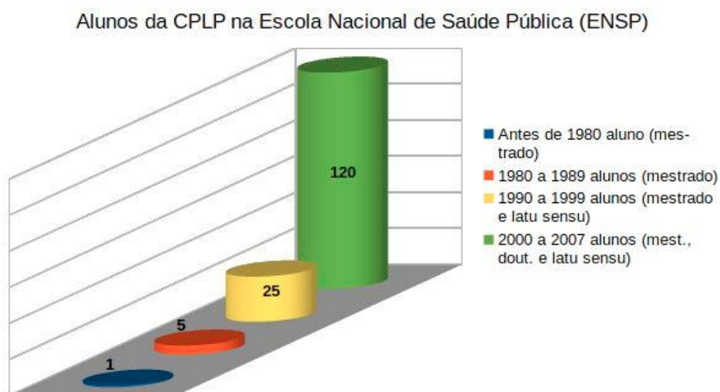
GRÁFICO 2 – ALUNOS DA CPLP NA ESCOLA NACIONAL DE SAÚDE PÚBLICA

número de alunos recebidos pela ENSP entre os anos de 2000 e 2007 em relação aos períodos anteriores.