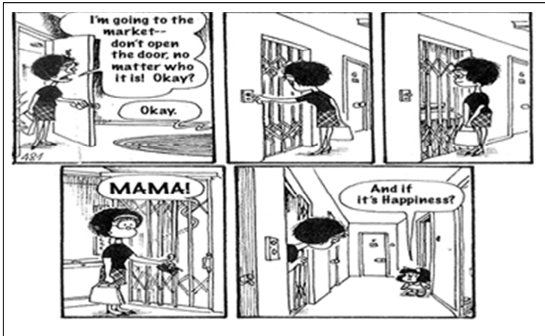
Figura 1 – Tira da Mafalda Fonte: Quarto da carochinha

da segurança muitas vezes as pessoas tornam-se reféns em suas casas ou infringem leis de trânsito.