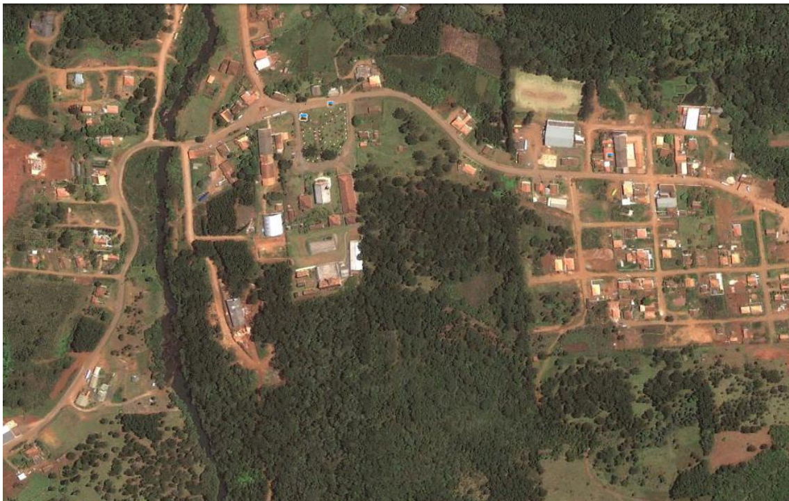
Figura 1 – Vista área parcial do Distrito Santana, Cruz Machado, Paraná.

Nesse sentido, foi aplicado um questionário com 6 (seis) perguntas abertas, semi-estruturado, com uma população amostral de 8 (oito) famílias de produtores familiares rurais, do Distrito de Santana, Município de Cruz Machado – PR, onde o casal de proprietários da unidade familiar responderam as questões, muitas vezes auxiliados pelos filhos.