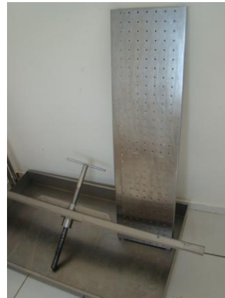
Figura 8: Prensa tanque