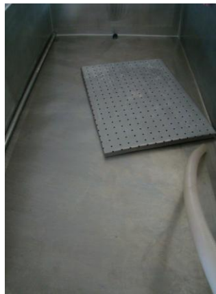
Figura 3: Tanque fabricação de Queijos