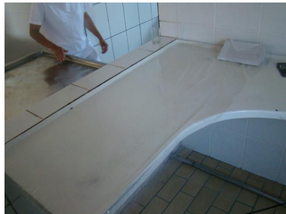
Figura 14: Bancada embalagem