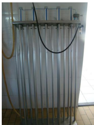
Figura 9: Prensa forma