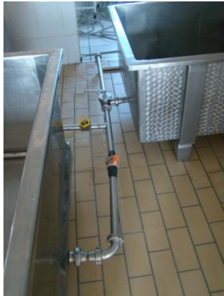
Figura 5: Conexão válvula junção tanque fabricação de Queijos