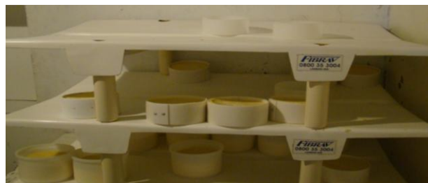
Figura 15: Estante câmara fria