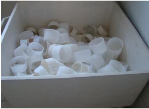
Figura 11: Formas