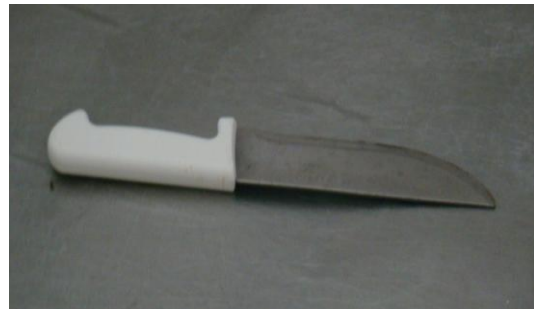
Figura 6: Faca