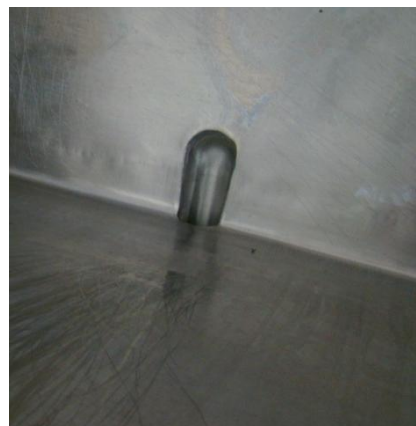
Figura 4: Saída tanque fabricação de Queijos