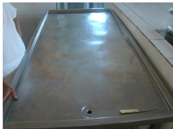
Figura 10: Mesa enformagem