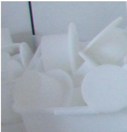
Figura 13: Tampas formas