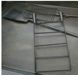
Figura 7: Liras, peneira e pá