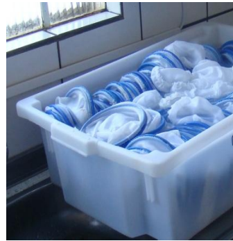
Figura 12: Desoradores