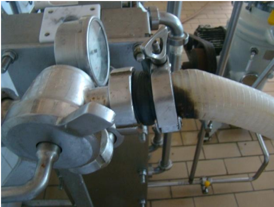
Figura 1: Conexão pasteurizador rápido/ mangueira