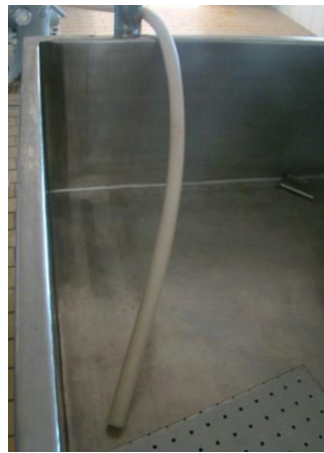
Figura 2: Mangueira tanque