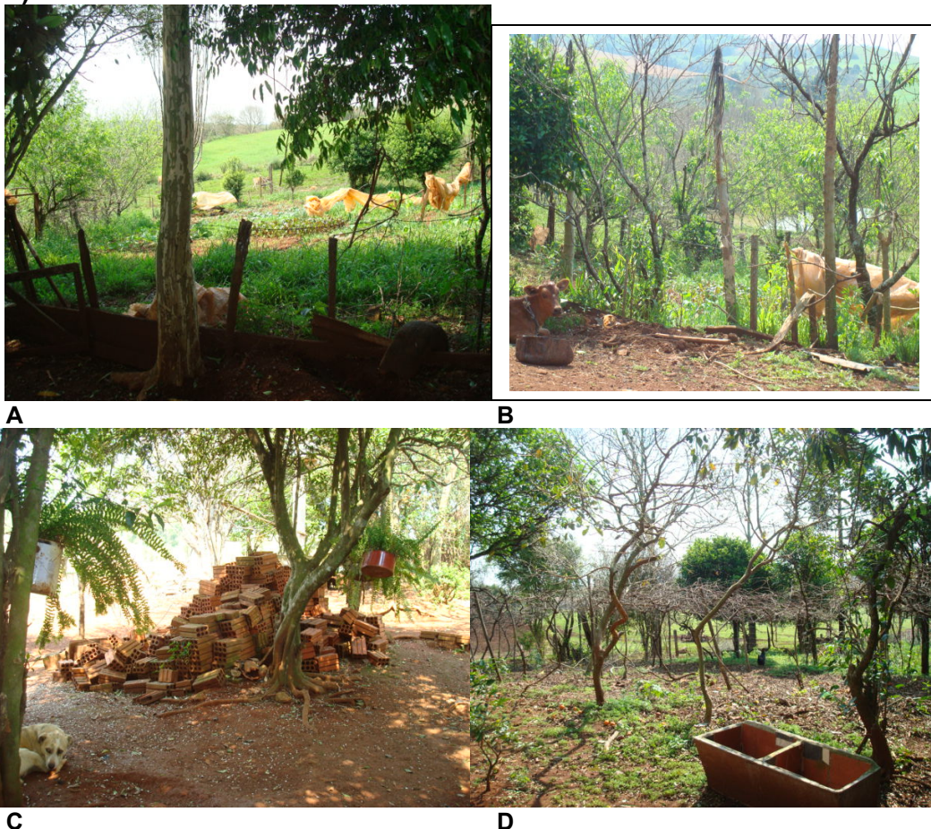
Figura 1- Local onde será construída a horta atualmente , e outros ambientes (C e D).

O custo com as vendas e a água será reduzido, pois além da fonte, e do poço o preço da água encanada é de 10,00 mensais apenas por ser área considerada rural e suas filhas buscarão os produtos quando necessário, trazendo para os compradores.