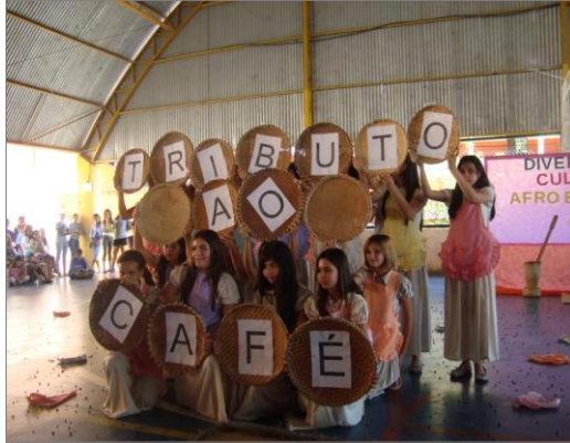
Coreografia com a música “A Flor do Cafezal”

Por outro lado, fizemos também, no decorrer destas atividades muitas leituras e discussões. Os textos escolhidos versavam sobre Movimentos dos Sem Terra (MST), leis, ética, moral, etc. Estes textos foram norteadores das reflexões feitas pelos alunos do Projovem. Discutimos sobre seus direitos empregatícios e sobre a importância, de por exemplo, o registro na carteira profissional.