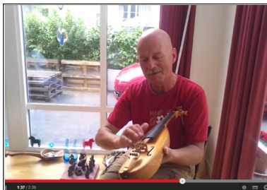
Vídeo poster – conceito para popularização da ciência.