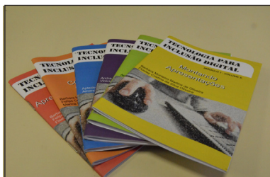
Livro produzido por alunos para o Curso de Tecnologia Inclusiva