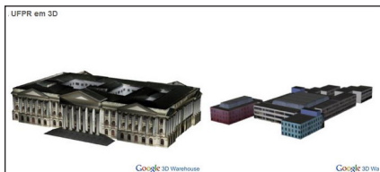
Imagem do Projeto UFPR 100 anos em 3D