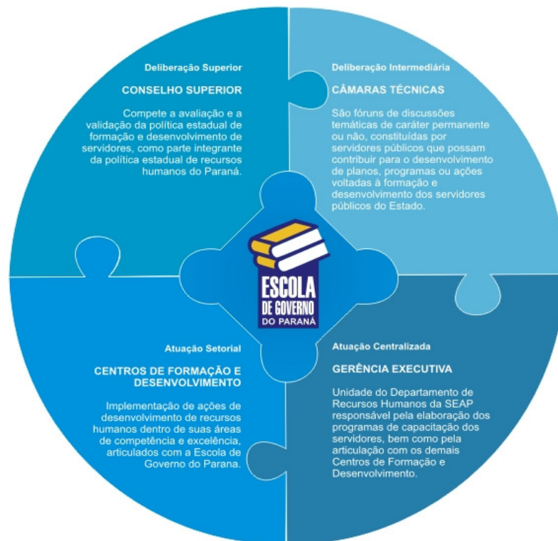
Figura 2 – Níveis Deliberativos

As áreas de atuação e a denominação dos Centros Formadores são apresentadas a seguir: