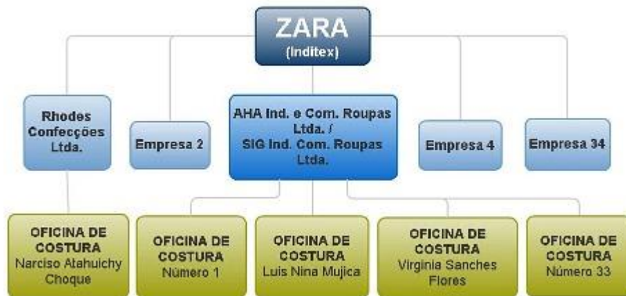
Figura 2: Organograma de Cadeia de Produção da Zara 159

Curiosamente, no ano de 2012 – ano posterior ao flagra de condições análogas à de escravidão – o grupo Inditex, ao qual pertence a marca Zara, registrou recorde em seus lucros: líder mundial do setor, apresentou um crescimento de 27% em seus lucros líquidos. Agora, a expansão do grupo econômico visa principalmente à China. 160