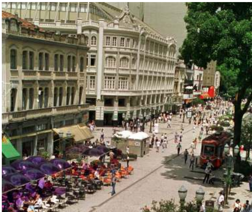
FIGURA 6 – Rua das Flores, no Centro de Curitiba.