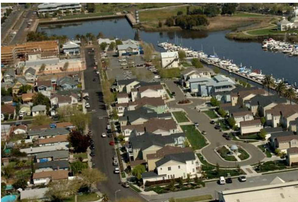
FIGURA 8 – Comunidade de Suisun City , no Estado da Califórnia, Estados Unidos.