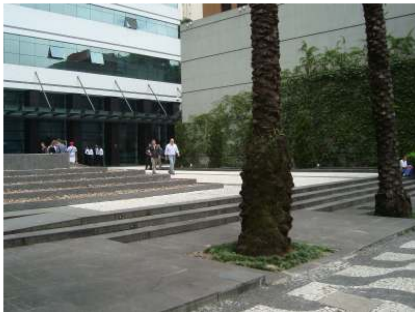
FIGURA 13 – Rua Brigadeiro Franco, no Centro de Curitiba.