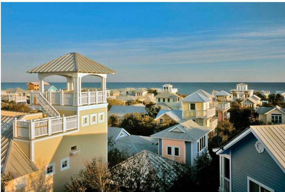
FIGURA 7 – Comunidade de Seaside , no Estado da Flórida, Estados Unidos.