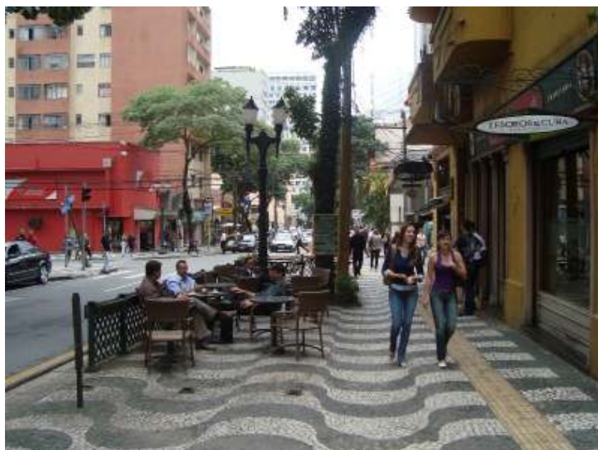
FIGURA 12 – Rua Comendador Araújo, no Centro de Curitiba.

A figura 12 mostra a Rua Comendador Araújo, situada no Centro de Curitiba, numa área próxima à divisa com o Bairro Batel. Nesta quadra identificam-se usos diversificados das construções e compartilhamento de espaços públicos. As calçadas mais largas incentivam a circulação de pedestres e os automóveis nesta região são adequadamente acomodados. Há ainda um contexto arquitetônico e paisagístico que dá identidade própria para o local.