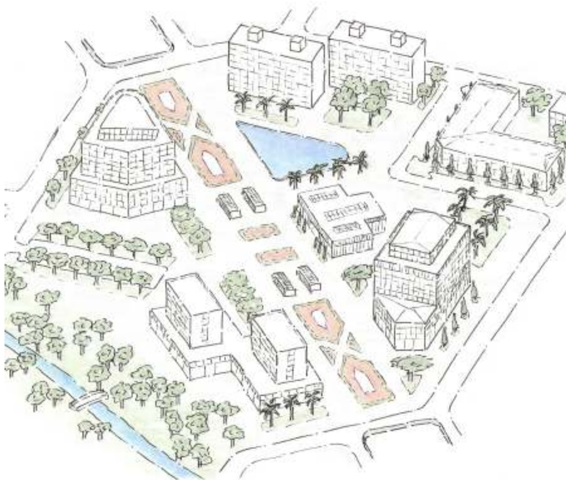
FIGURA 16 – Renderização do Pólo Fagundes Varela.