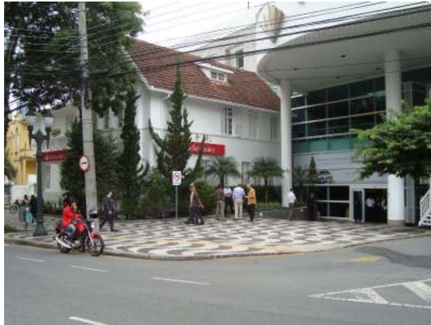
FIGURA 15 – Rua Comendador Araújo, no Bairro Batel, em Curitiba.

Mais um trecho da Rua Comendador Araújo é mostrado na figura 15, agora pertencendo ao Bairro Batel, delimitado com o Centro de Curitiba pela Rua Desembargador Motta.