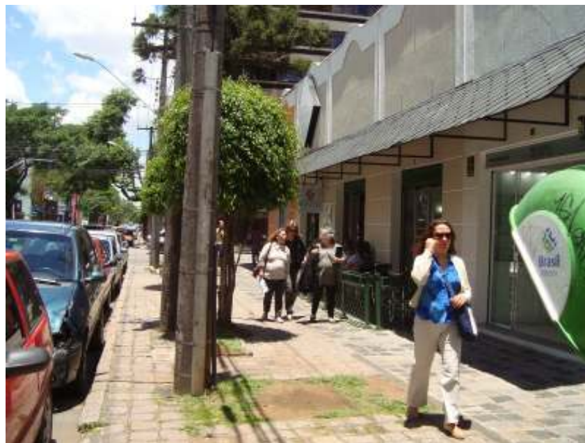
FIGURA 10 – Rua Doutor Faivre, no Centro de Curitiba.