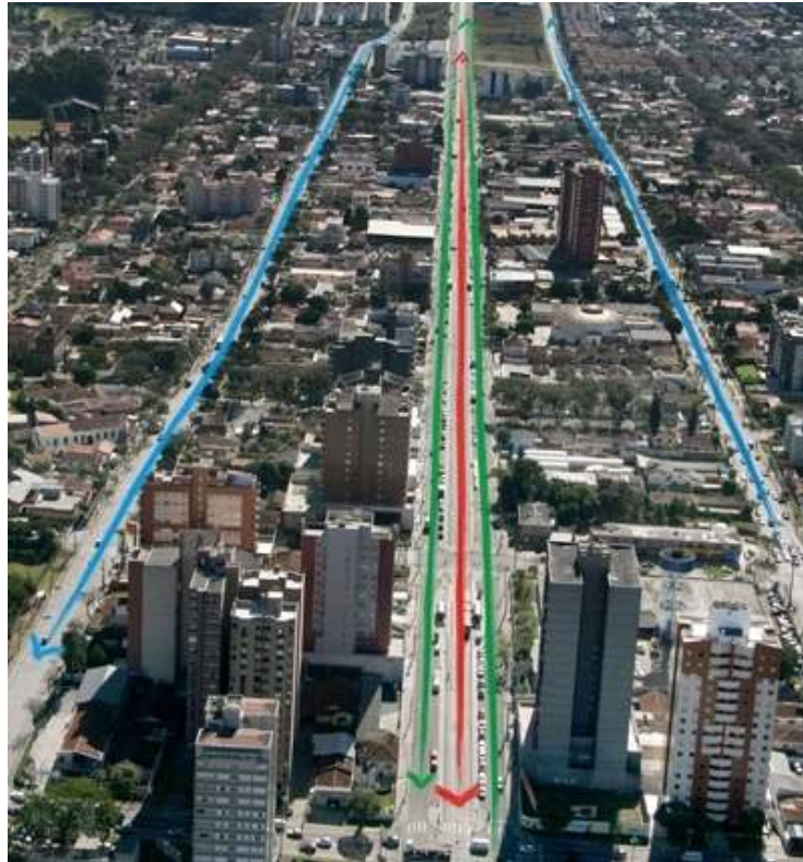
FIGURA 2 – Sistema trinário em eixo estrutural de Curitiba.