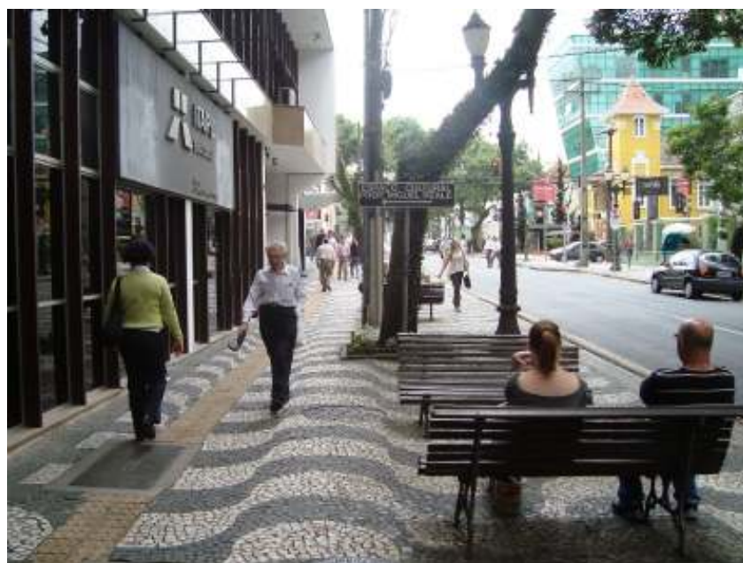
FIGURA 14 – Rua Comendador Araújo, no Centro de Curitiba.

A figura 14 mostra outro trecho da Rua Comendador Araújo, ainda no Centro de Curitiba, com espaços públicos compartilhados, usos comerciais variados das construções, segurança para os pedestres e preservação das edificações históricas.