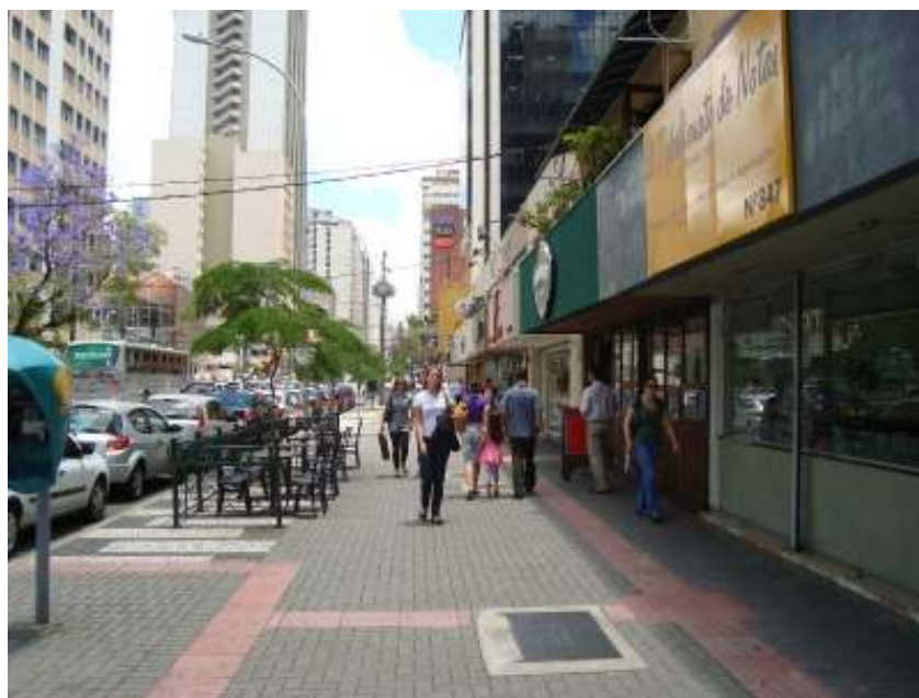
FIGURA 9 – Rua Marechal Deodoro, no Centro de Curitiba.

A figura 9 mostra uma calçada da Rua Marechal Deodoro, localizada no Centro de Curitiba, onde se identificam usos comerciais variados das edificações, compartilhamento de espaço público, acesso facilitado ao transporte coletivo e segurança para os pedestres, incentivando-os a caminharem pela região.