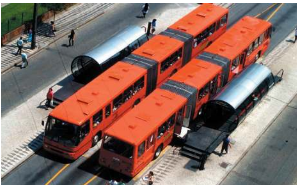
FIGURA 5 – Canaleta para ônibus biarticulado em eixo estrutural de Curitiba.

Segundo IPPUC (2006), Curitiba tinha inicialmente seu transporte coletivo composto por linhas diametrais ou concêntricas de ligação dos bairros com o centro, como a maioria das cidades brasileiras. A implantação de um novo sistema criou os eixos norte e sul, ligados linearmente ao centro da cidade. Entraram em operação as linhas expressas e os alimentadores, e a integração passou a acontecer em terminais. Sequencialmente foram incorporadas as linhas inter-bairros e implantados os eixos leste e oeste, definindo-se assim a RIT – Rede Integrada de Transportes. A URBS – Urbanização de Curitiba S.A., passou a assumir a gerencia do sistema como concessionária das linhas, e empresas privadas começaram a operar como permissionárias. As linhas diretas foram implementadas ao sistema, destinadas a suprir demandas pontuais, com embarque e desembarque em nível em estações-tubo. Sequencialmente entraram em operação os ônibus biarticulados nas linhas expressas, também com embarque e desembarque em nível. A figura 5 mostra uma canaleta exclusiva para ônibus biarticulado em um dos eixos estruturais de Curitiba, e estações-tubo para embarque e desembarque de passageiros.