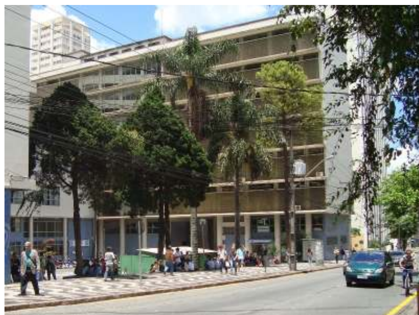
FIGURA 11 – Rua Amintas de Barros, no Centro de Curitiba.

A figura 11 mostra a Praça da Reitoria da Universidade Federal do Paraná, localizada na Rua Amintas de Barros, onde se verifica um exemplo de espaço público aberto e compartilhado. Esta região do Centro de Curitiba está próxima da divisa com os bairros Alto da Glória e Alto da XV.