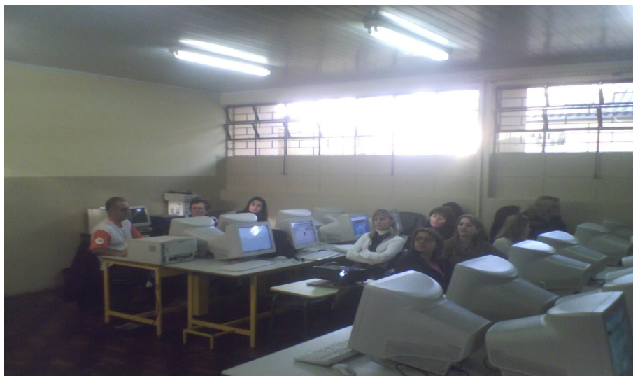
Foto 1. TECNOLOGIAS NA EDUCAÇÃO

Este modelo de oficina aconteceu em várias escolas, mas a experiência citada é do Colégio Estadual Dom Pedro I em Guarapuava – Pr. O trabalho foi registrado através de fotos: