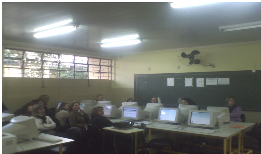
Foto 2. TECNOLOGIAS NA EDUCAÇÃO