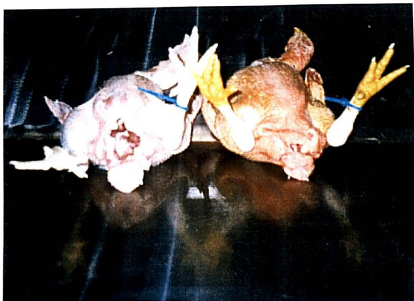
FIGURA 2 – COLORAÇÃO DA CARÇA DE AVES QUE RECEBERAM RAÇÃO A BASE DE SORGO COMPARADAS AS QUE RECEBERAM RAÇÃO A BASE DE MILHO

Assim, para mercados que demandam coloração de carcaças dos frangos, deve-se adicionar a ração ingredientes com poder pigmentante, embora o pigmento amarelo não apresente nenhum valor nutricional como comenta LANCINI (1994).