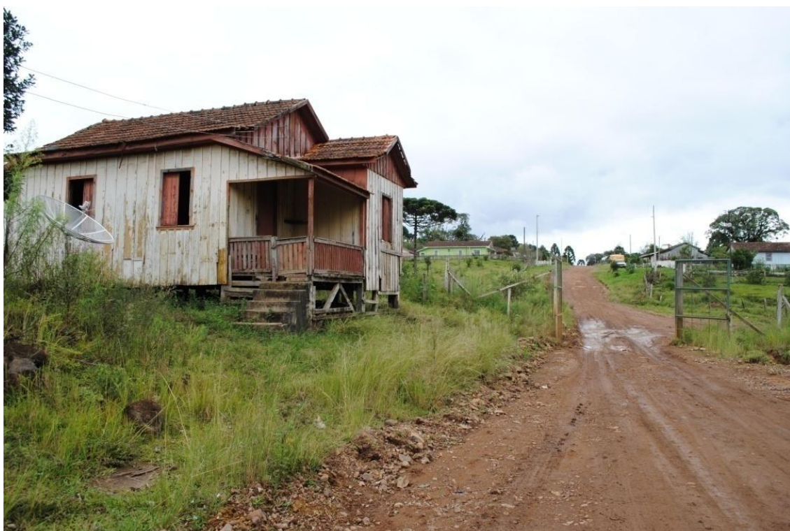
6. Um dos antigos portões