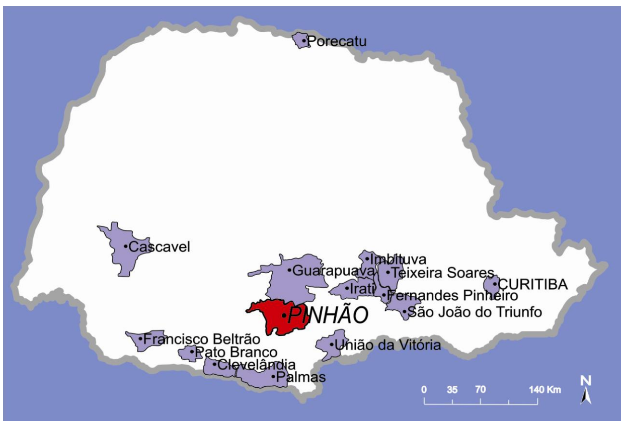
FIGURA 1 – MAPA DO PARANÁ COM ÊNFASE A PINHÃO E OUTROS MUNICÍPIOS

várias concepções que os posseiros elaboram acerca da condição desses funcionários da empresa, que podem ser percebidos como guardas , jagunços ou pistoleiros . Finalmente, o Capítulo 4 visa discutir interações entre posseiros e jagunços , de modo a perceber que elementos e valores são disputados no interior dessas relações, e como os discursos sobre elas dizem respeito a determinadas concepções de resistência na terra.