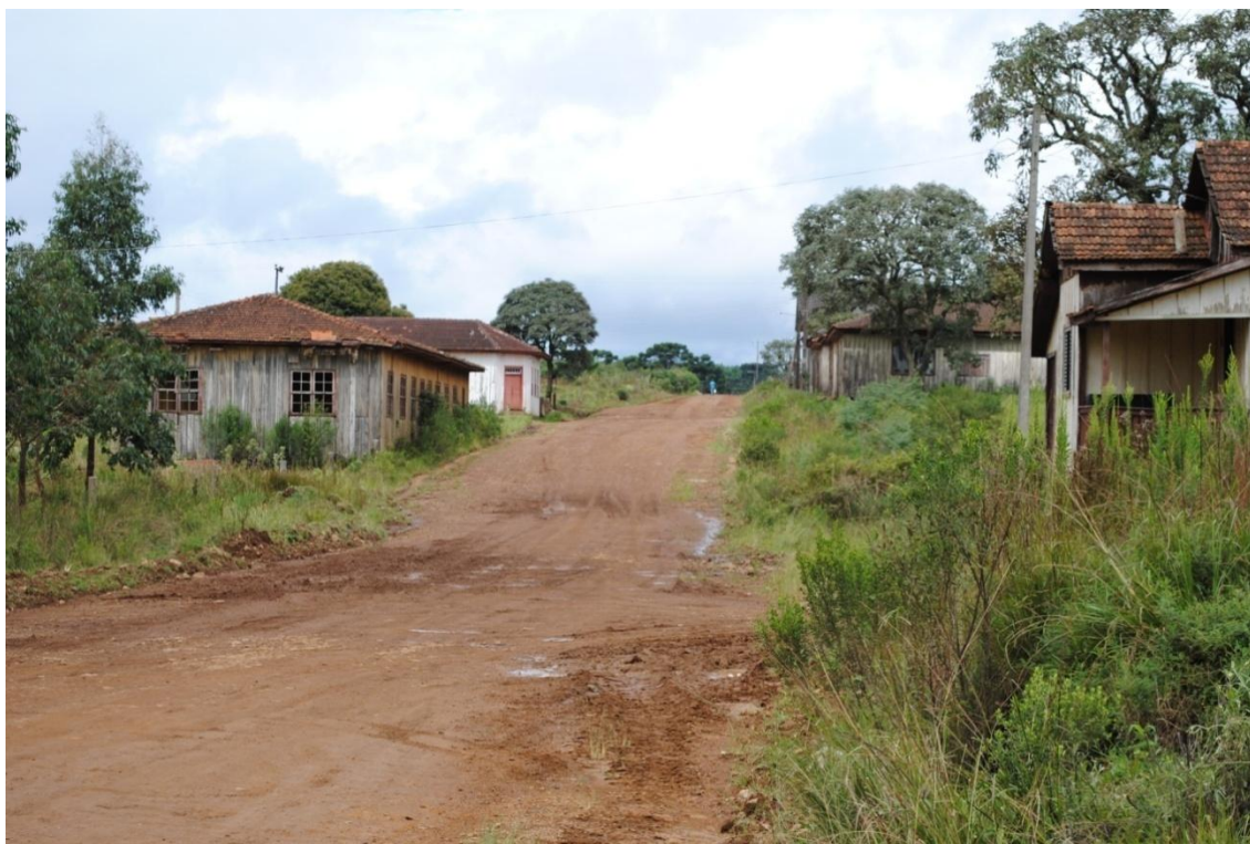
4. Estrada principal