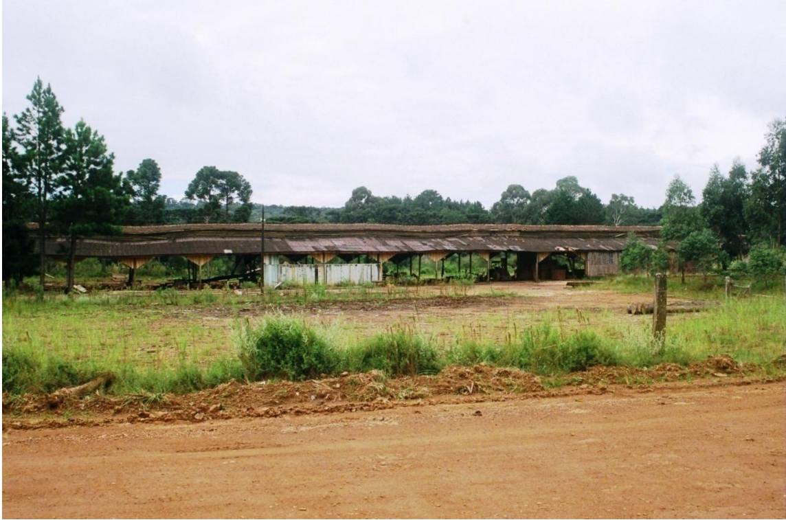
7. Antigo estabelecimento da serraria