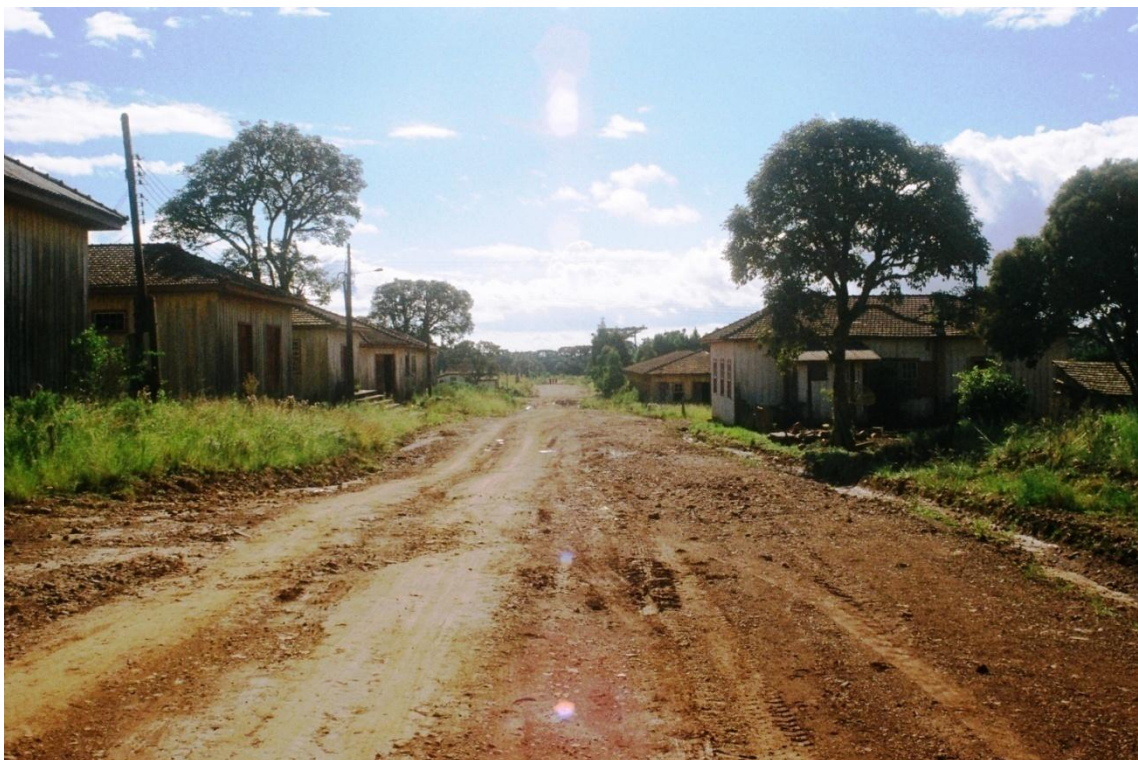
5. Estrada principal