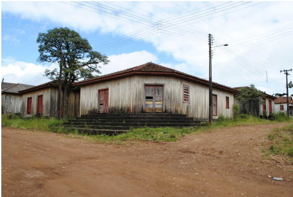
3. Antigo estabelecimento comercial da estrada principal