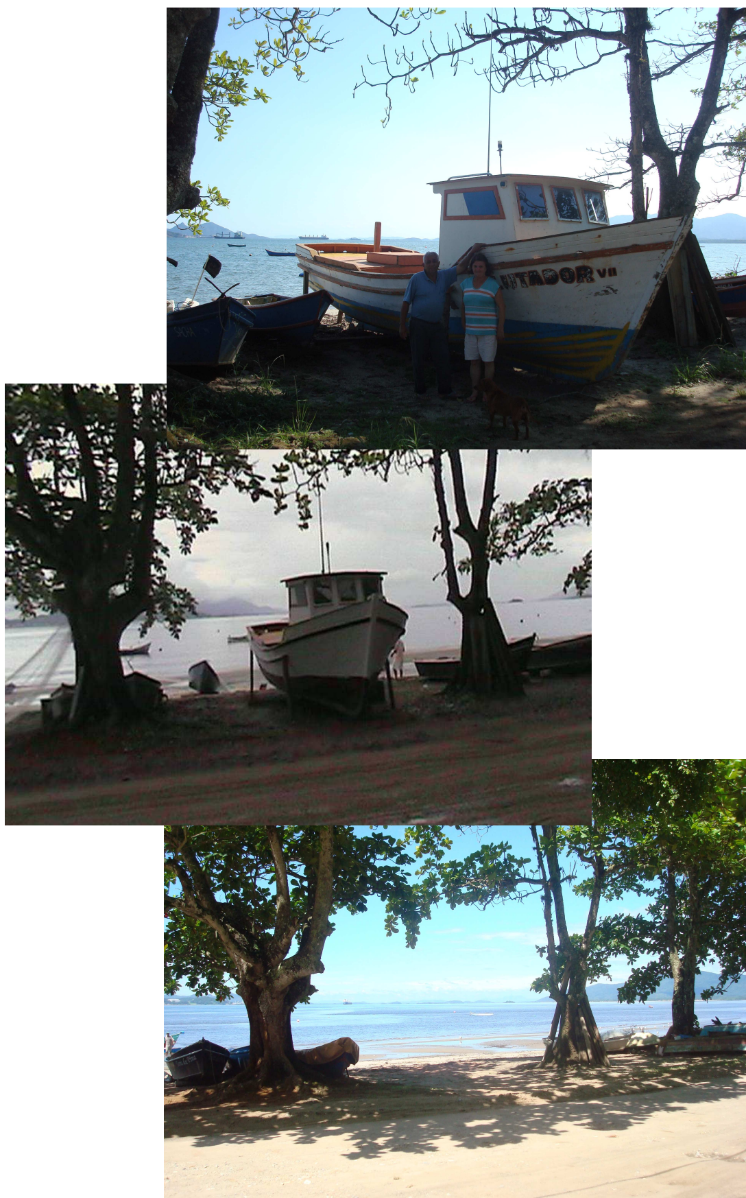
Figura 9. Três momentos do Lutador - De cima para baixo: com seu Lelé e dona Anair, com o nome grafado e gasto; sozinho, já sem nome e pintado para venda; ausente.