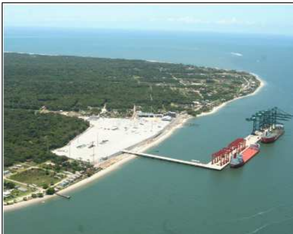
Figura 4. Vista aérea do Porto de Itapoá finalizado: inauguração em 22/12/2010