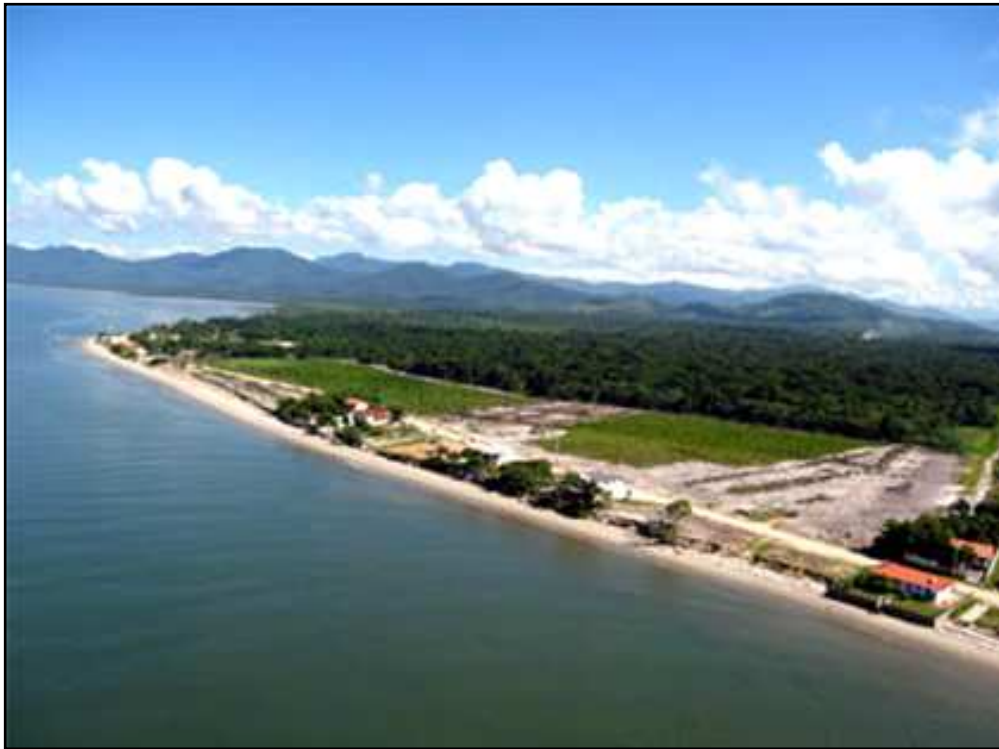
Figura 3. Vista aérea do Porto de Itapoá em construção: área já desmatada para a instalação do porto em Figueira do Pontal.