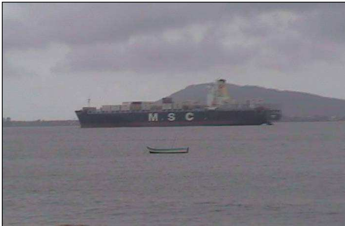
Figura 10. A canoa e o cargueiro

pela baía em direção ao porto. Minúscula, discreta, humilde, mas ainda assim, VISÍVEL.