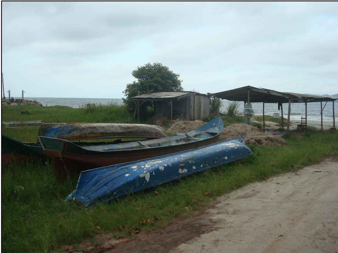
Figura 7. Barracão do seu Kalanga e as canoas de um pau só