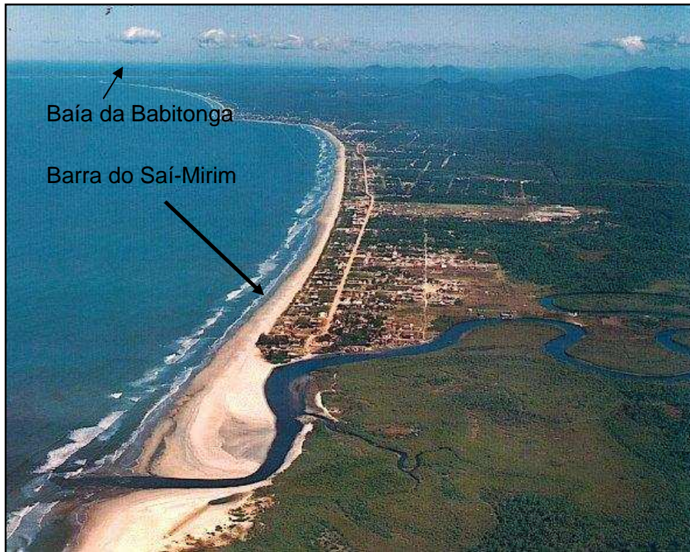
Figura 2. Vista aérea do município de Itapoá: Barra do Saí-Mirim e Baía da Babitonga marcados.