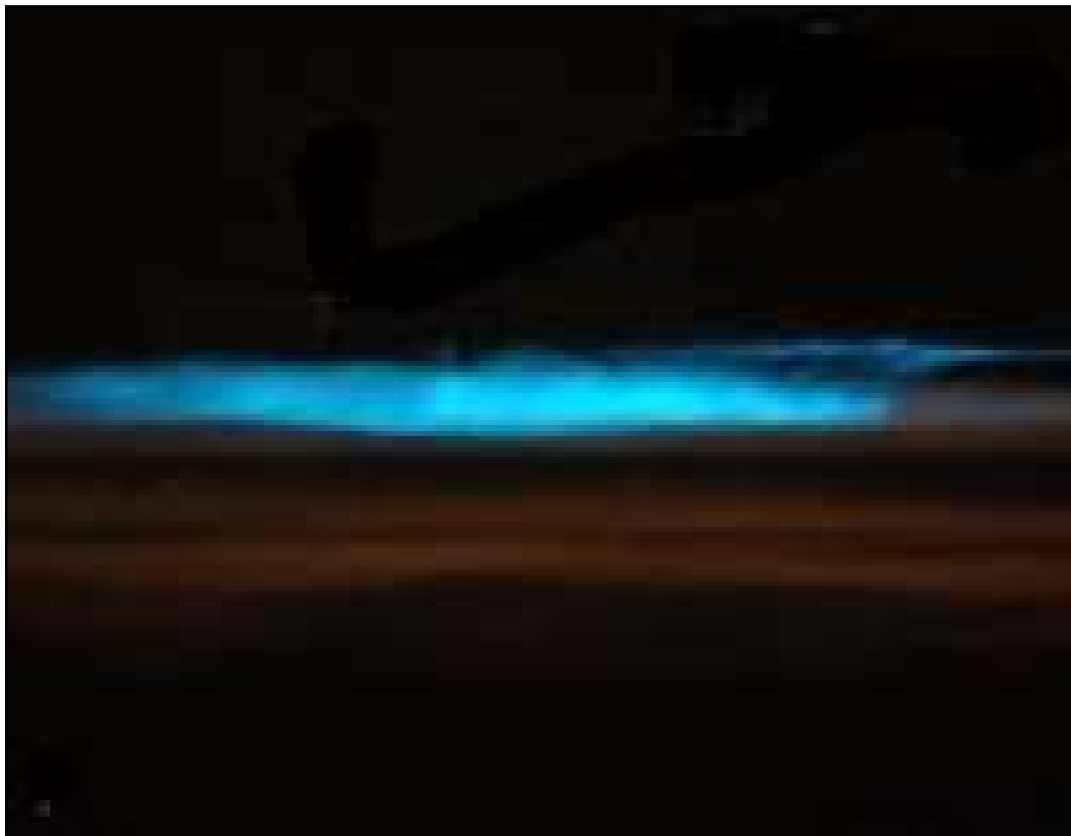
Figura 5. Chega de noite tem uma ardentia no mar... Bioluminescência causada pelo dinoflagelado Noctiluca. Pode ser a causa da noite de ardentia no mar vivenciada pelo seu Manoel.