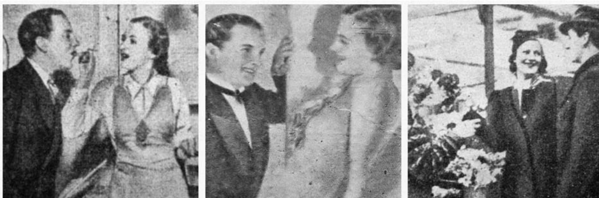
FOTO 1 - CHARGE SOBRE O MODO DE COMPORTAR-SE PARA AS MOCINHAS "CASADOIRAS"

Se as mulheres (das décadas de 1936-1950) vinham, teoricamente, conquistando igualdade de direitos sociais, era-lhes cobrada, na prática, uma série de comportamentos bem pouco condizentes com as aspirações do feminismo. Em revista da época, textos acompanhados de ilustrações sugestivas evidenciam quais eram as representações do que se entendia como papel e função das mulheres na família: ser dócil ao que delas esperava a sociedade e responsáveis pela constituição, manutenção e aderência dos membros ao seu núcleo central: pai-mãe, como cuidadores da prole. Isto para uma camada social média.