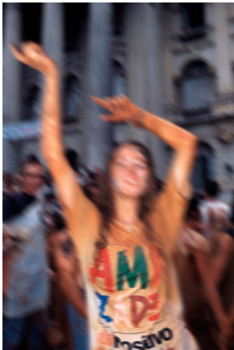
FOTO 5 - GRUPO DE JOVENS COMEMORANDO O "TROTE", CERIMÔNIA QUE SIMBOLIZA A INICIAÇÃO NA VIDA ESTUDANTIL. VESTIBULAR DA UFPR, 1995