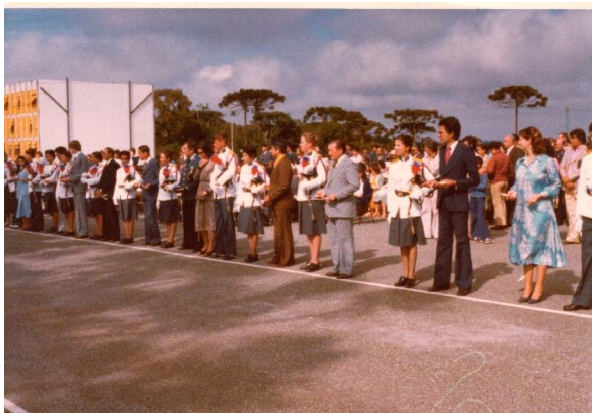
FOTO 4 - FORMATURA DA PRIMEIRA TURMA DE SARGENTOS – BATALHÃO FEMININO – 20 OUT. 1978