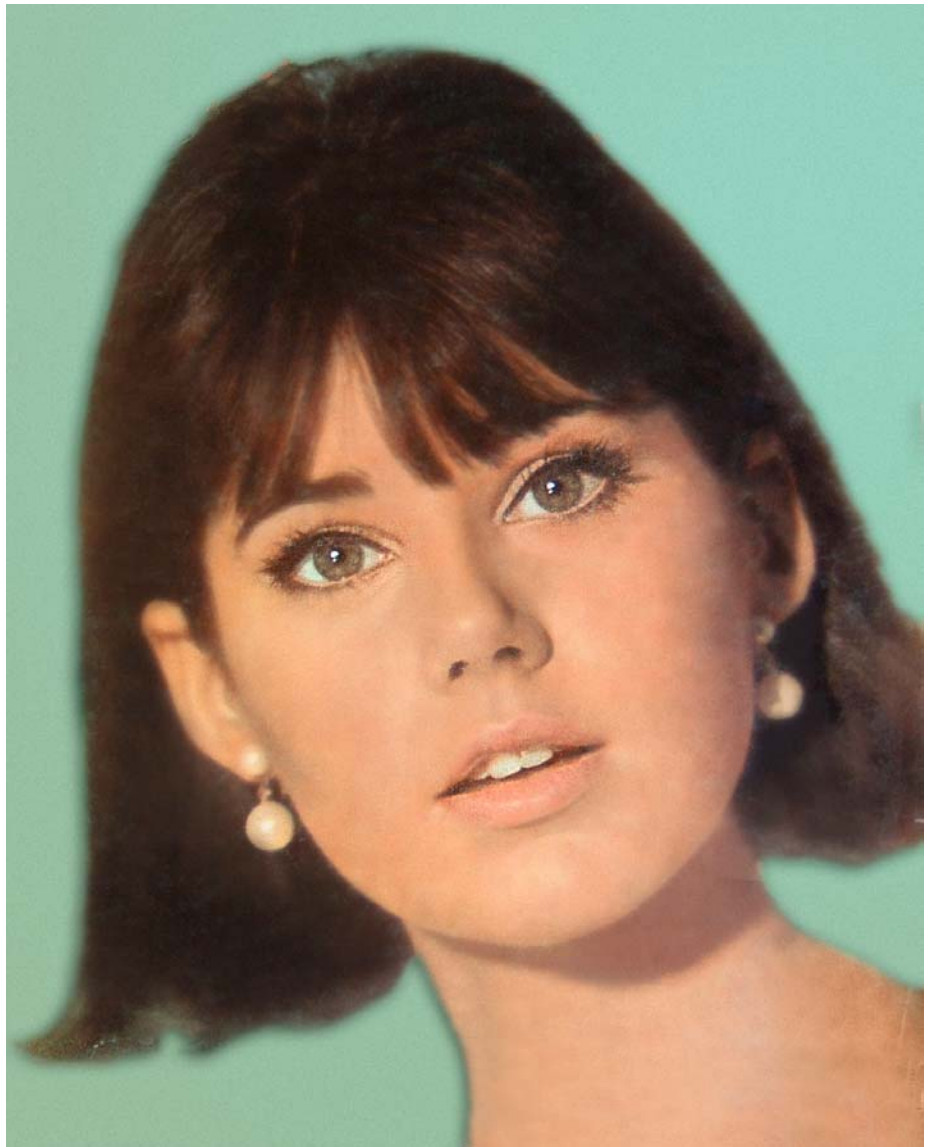
RAQUEL. Revista Claudia . São Paulo: Abril, ano V, n.41, capa, fev. 1964.