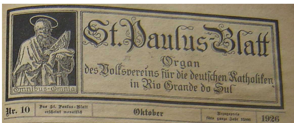
FIGURA 2 – CAPA DA ST. PAULUS-BLATT DE OUTUBRO DE 1926.

Essas constatações nos remetem à busca da compreensão dos sentidos discursivos e práticos que essa denominação representou para a organização de comunidades leitoras no Rio Grande do Sul. É possível conjecturar que, da mesma forma que as epístolas de São Paulo, a St. Paulus-Blatt representou o espaço da normatização de procedimentos e de unidade discursiva em torno do catolicismo social que a Sociedade União Popular representava. É possível perceber que a circulação do órgão de imprensa da Sociedade não só procurou unir os católicos em torno de uma leitura sadia, mas a exemplo de Paulo, buscou consolidar uma comunidade. Assim, pode-se dizer que no aspecto prático a revista estava instruindo os colonos católicos do estado a superar suas dificuldades materiais, culturais e religiosas, e ao mesmo tempo constituía comunidades a partir da leitura.