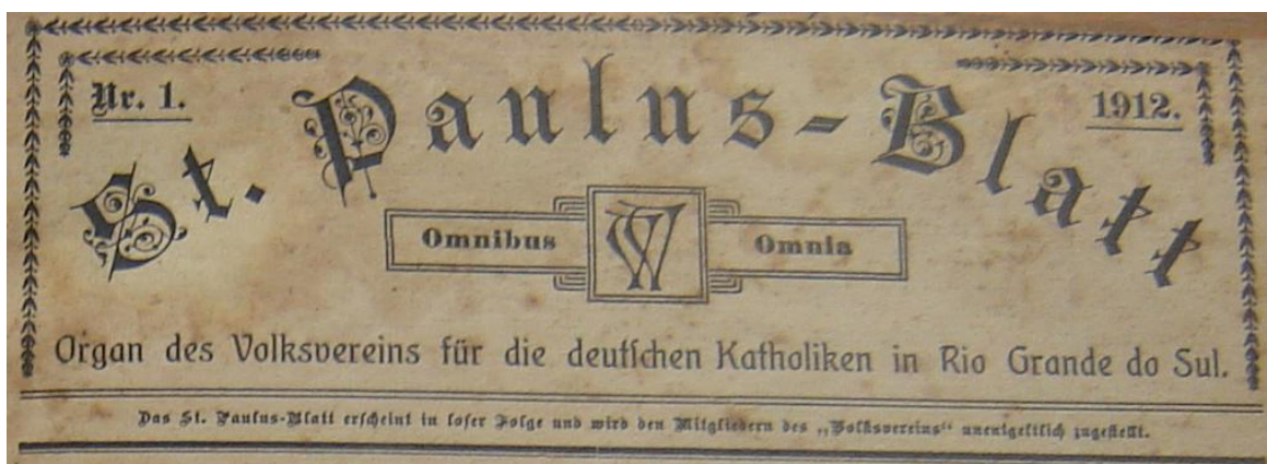
FIGURA 1 – CAPA DA PRIMEIRA EDIÇÃO DA ST. PAULUS-BLATT.