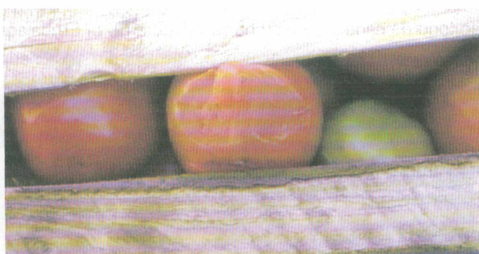
FIGURA 4. DANO MECÂNICO PROVOCADO PELA CAIXA “K” 3

- Deve-se evitar também caixas de alta rugosidade e abrasivas, e/ou utilizar acessórios internos como bandejas plásticas ou de papelão, para reduzir a formação de ferimentos no produto.