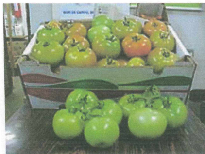
FIGURA 6. CAIXA DE PAPELÃO PARA TOMATES 5