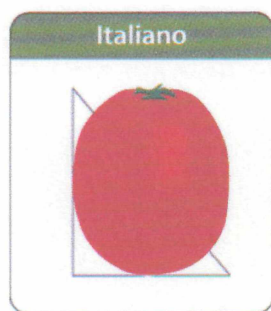
FIGURA 1. TOMATE OBLONGO

- Oblongo: Quando o diâmetro longitudinal for maior que o transversal.