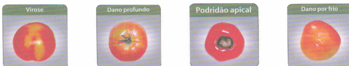
FIGURA 3. TOMATES COM DEFEITOS 2