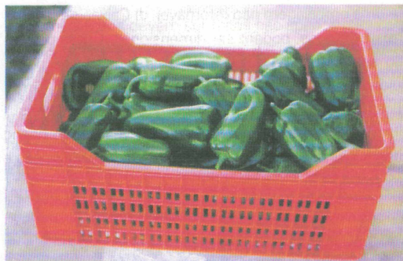
FIGURA 5. “CAIXA EMBRAPA”. 4

lavagem e higienização e não constitui veículo de contaminação. Comporta pequeno número de camadas de produtos, possui superfície lisa e dispositivo de encaixe para empilhamento, não é tampada e, por dentro, tem cantos arredondados. Auto-expositiva, vai direto do campo para o supermercado. A capacidade da caixa desenvolvida pela EMBRAPA para o tomate é de 13 kg.