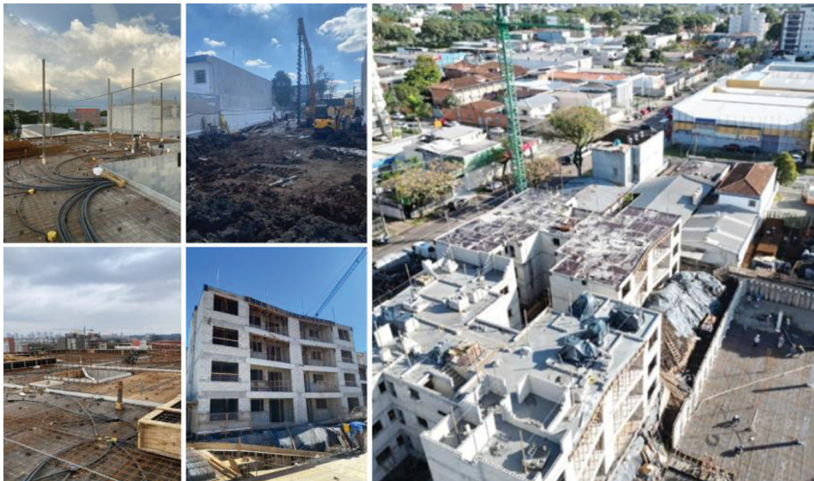
FIGURA 3 – CARACTERIZAÇÃO DA OBRA

Esta caracterização é essencial para compreender o cenário e levantamento dos riscos envolvidos. A FIGURA 3, ilustra de uma maneira geral o tamanho da obra e as atividades que estavam em execução.