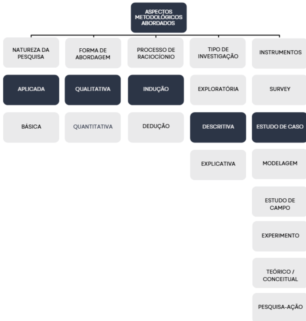
FIGURA 1 – CLASSIFICAÇÃO DE PESQUISA