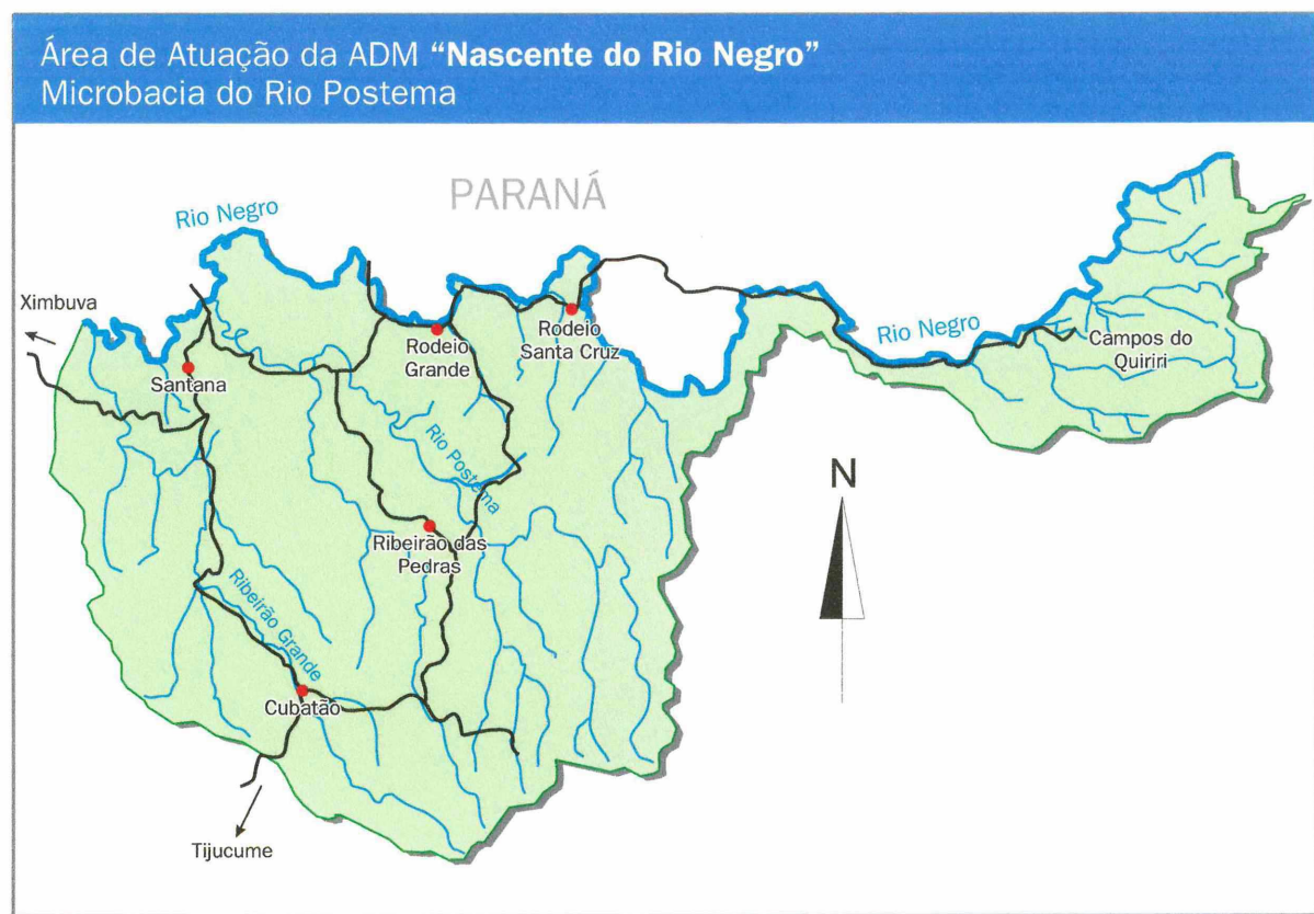
Mapa 2: Microbacia Nascente do Rio Negro

A área da microbacia pode ser visualizada no mapa a seguir: