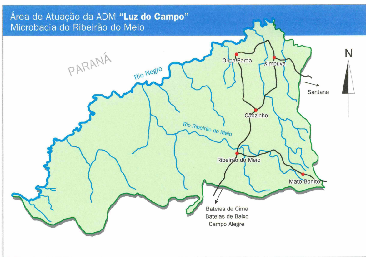
Mapa 1: Microbacia Luz do Campo

A área da microbacia pode ser visualizada no mapa a seguir: