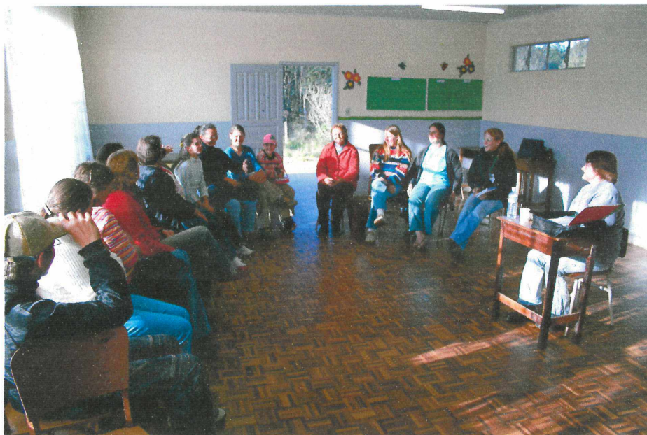
Foto 1: Reunião do Grupo de Artesanato de Lã – Microbacia - Ribeirão do Meio, setembro, 2006.