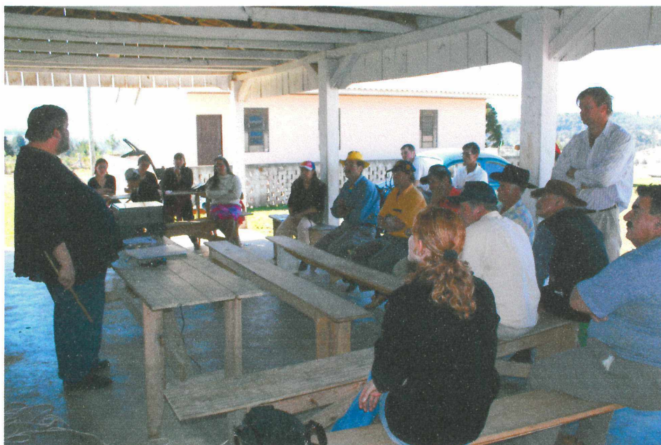
Foto 2 - Reunião de Crédito Rural – Microbacia Rio Postema. Agosto, 2006.