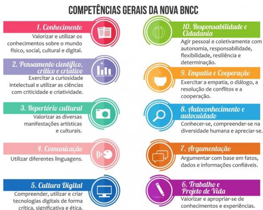
FIGURA 1 - COMPETÊNCIAS GERAIS DO ENSINO FUNDAMENTAL

A Educação Básica engloba a Educação Infantil, Ensino Fundamental e o Ensino Médio. Segundo o que é proposto pela BNCC, são nesses anos em que devem ser desenvolvidos as 10 Competências Gerais. Para o Ensino Fundamental estabelece um currículo dividido em etapas conforme a FIGURA 1.