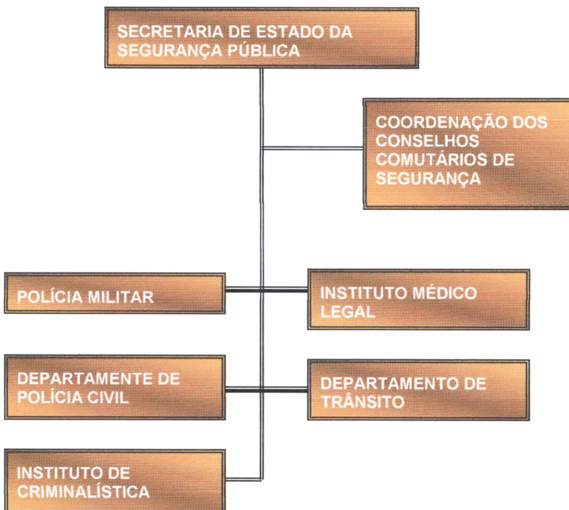
FIGURA 1 - ORGANOGrama DO SISTEMA DE SEGURANÇA DO ESTADO DO PARANÁ.

Com o Plano Nacional de Segurança Pública, advieram algumas novas denominações, e o Sistema de Segurança Pública é um deles. Este tratamento dado se relaciona diretamente na formação de um sistema e no molde paranaense, modelo sistematizado que é formado com a centralização na Secretaria de Segurança Pública, que se forma consoante este organograma: