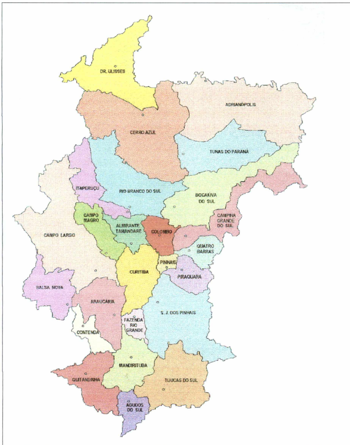
FIGURA 4 - MUNICÍPIOS DA REGIÃO METROPOLITANA DE CURITIBA ÁREA DE ATUAÇÃO DO 17º BPM