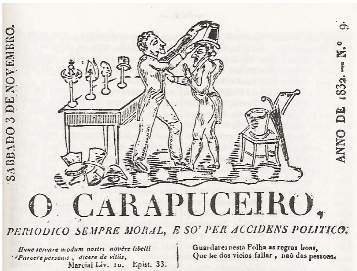
Figura 2: O cabeçalho do periódico O Carapuceiro .

No primeiro número, foram descritas as supostas motivações que levaram o então frei beneditino a iniciar tal publicação: “Escrevo pois este periódico contra os vícios, 1º Por que estes muito prejudicam a sociedade, e eu quisera ver muito feliz a minha Pátria; 2º (...) assentou-se me no ânimo adquirir alguns vinténs (...)” 98 . É necessário ressaltar que quando Lopes Gama diz pátria , ele está se referindo ao Brasil. Segundo Márcia R. Berbel, tal terminologia teria outro significado à época das cortes constituintes de Lisboa (1821-22). Pátria , para os deputados brasileiros presentes nas cortes, seria seu lugar de origem. Este não seria o Brasil, e sim a comunidade que os elegeu - a Província. A nação da qual esses deputados se sentiam parte seria a portuguesa. O Brasil, à época da independência, se enquadraria apenas no conceito de país . Assim, segundo o discurso desses deputados brasileiros, São Paulo e Bahia seriam suas pátrias . O Brasil seu país . Portugal sua nação . No entanto, houve uma virada na utilização desses conceitos em meados da década de