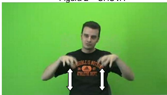
Figura 2 – CHUVA

As análises realizadas neste trabalho se basearam em sete dos 32 sinais coletados por (Xavier 2014), a saber, CHUVA (Figura 2) 7 , EXPERIÊNCIA (Figura 3), NÃO-SABER (Figura 4), ALÍVIO (Figura 5), VONTADE (Figura 6), FÁCIL (Figura 7) e SOFRER (Figura 8), tanto em sua forma basal, quanto na intensificada, produzidas por 12 sujeitos ( 1 \times 2 \times 7 \times 12 = 168 ). A seleção dos sinais levou em consideração a presença ou não de contato na forma de citação e, no primeiro caso, o tipo de contato: inicial, permanente ou final. Assim, foram selecionados dois sinais sem contato com o corpo (CHUVA e EXPERIÊNCIA), dois sinais com contato inicial (NÃO-SABER e FÁCIL), dois sinais com contato permanente (ALÍVIO e VONTADE) e um sinal com contato final (SOFRER). Objetivou-se com essa seleção observar a interação entre essa característica articulatória e as estratégias de intensificação.