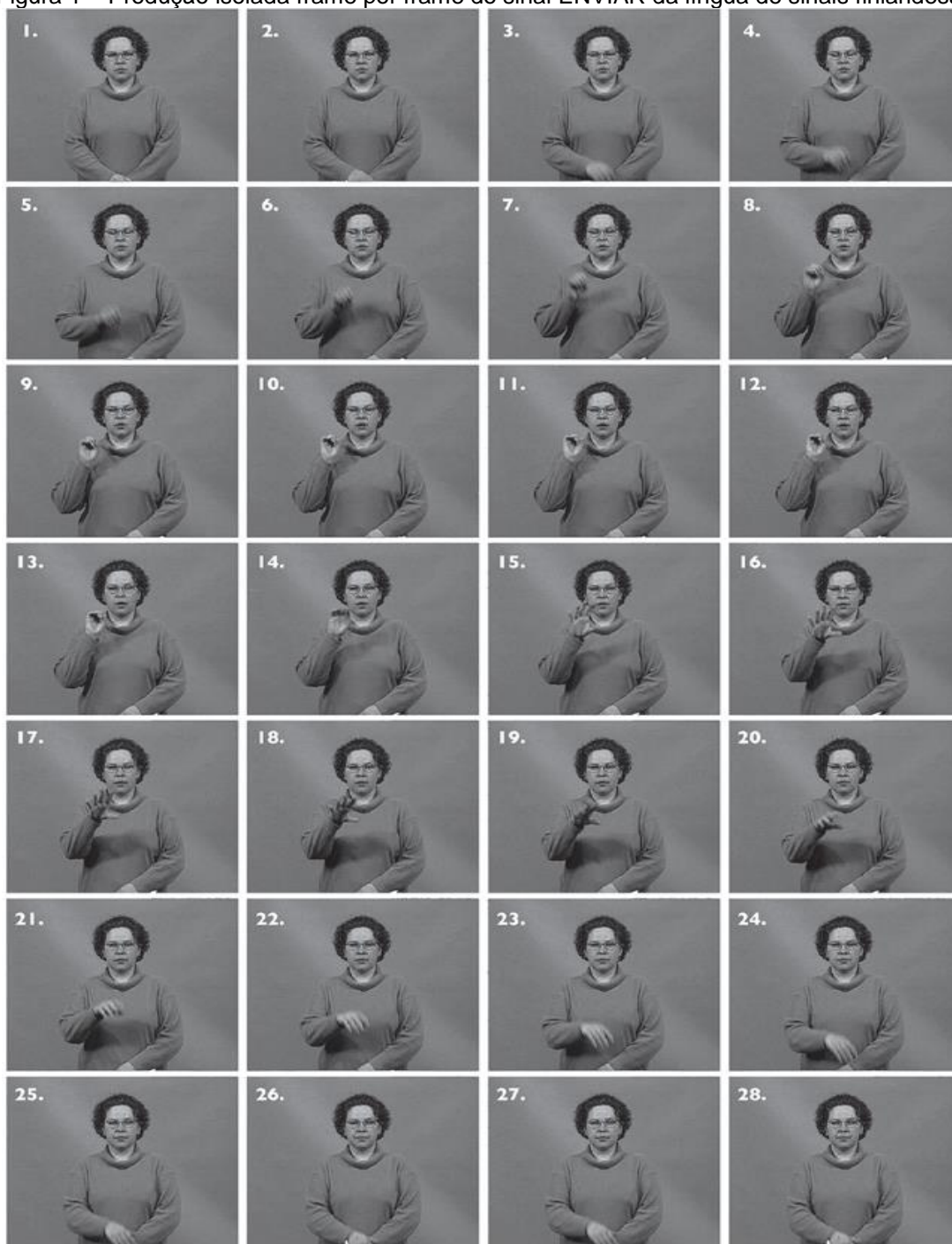
Figura 1 – Produção isolada frame por frame do sinal ENVIAR da língua de sinais finlandesa.