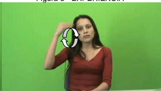
Figura 3 - EXPERIÊNCIA