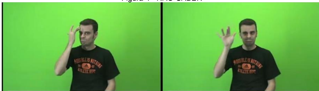
Figura 4 - NÃO-SABER