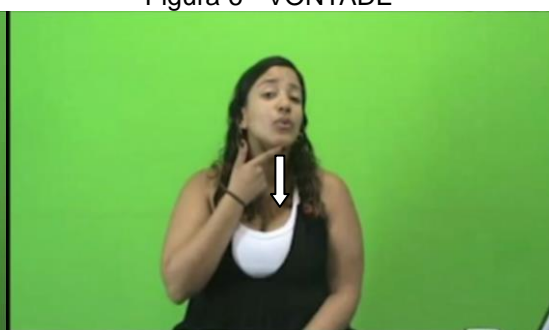
Figura 6 - VONTADE