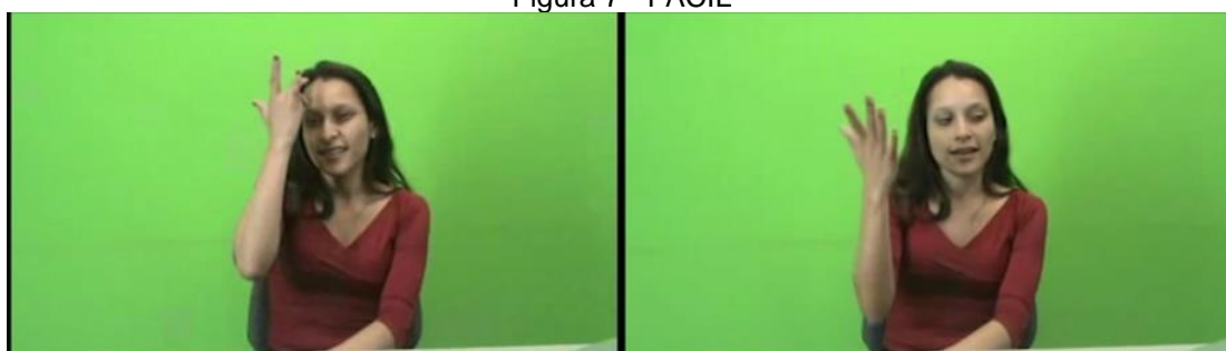
Figura 7 - FÁCIL