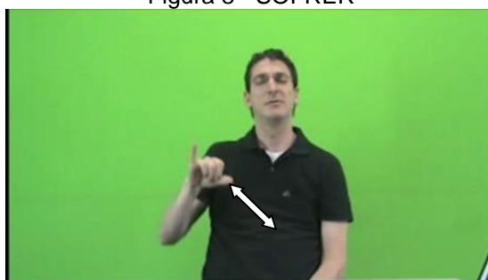
Figura 8 - SOFRER