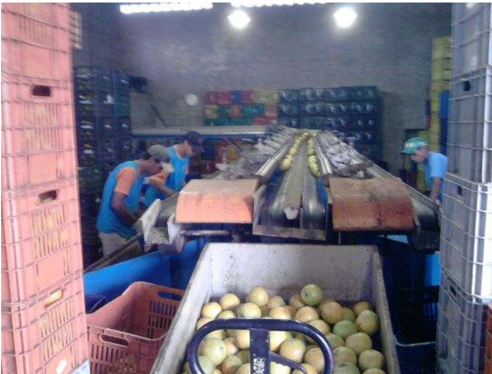
Seleção da fruta