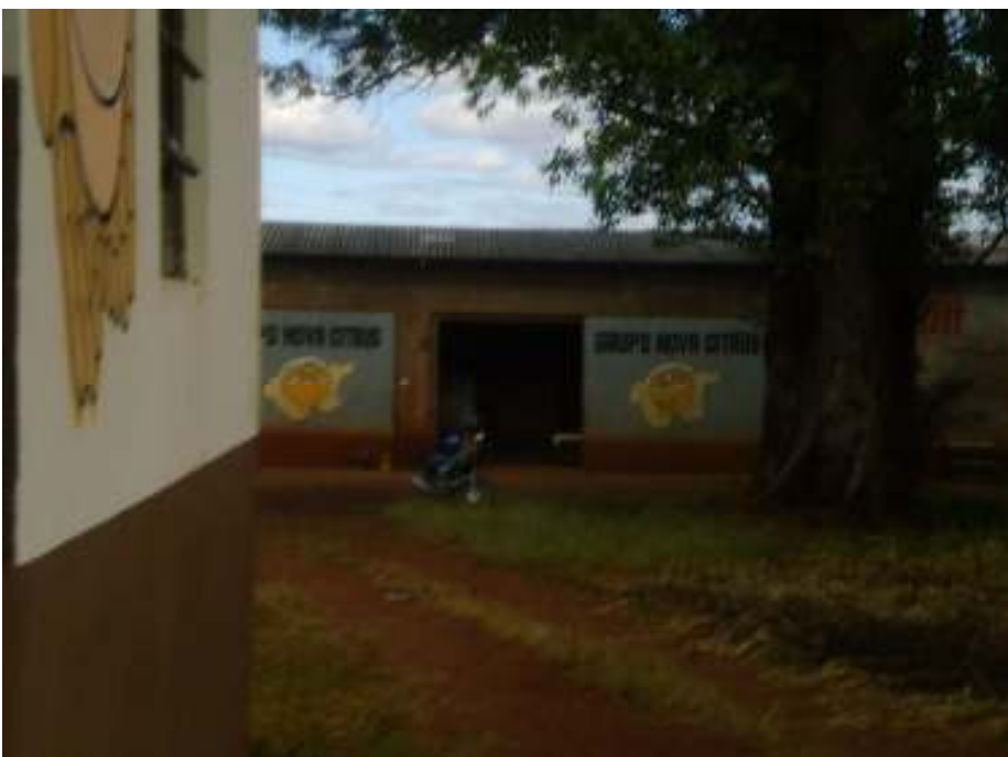
Barracão, vista externa.

dos produtores no debate das tecnologias empregadas e o envolvimento dos órgãos públicos no direcionamento das práticas a serem aplicadas e conjugando com órgãos de pesquisa(IAPAR- Instituto Agronomico do Parana) e órgãos de fiscalização(DEFIS/SEAB - Departamento de Fiscalização Vegetal da Secretaria da Agricultura do Estado do Paraná) e empresas particulares (Gravena) demonstrou ser altamente interessante.