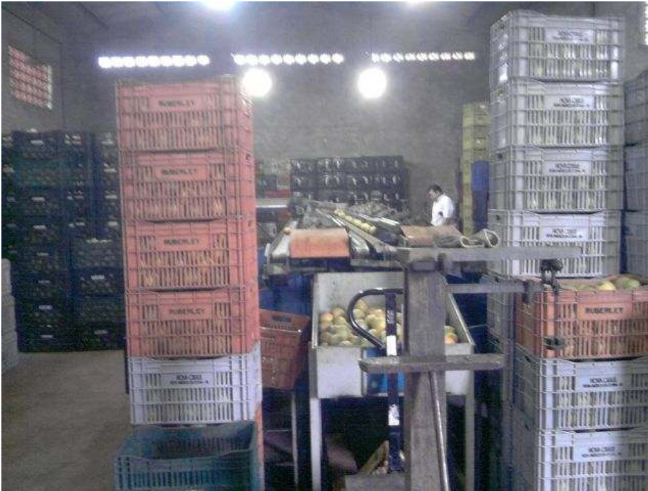
Barracão vista interna