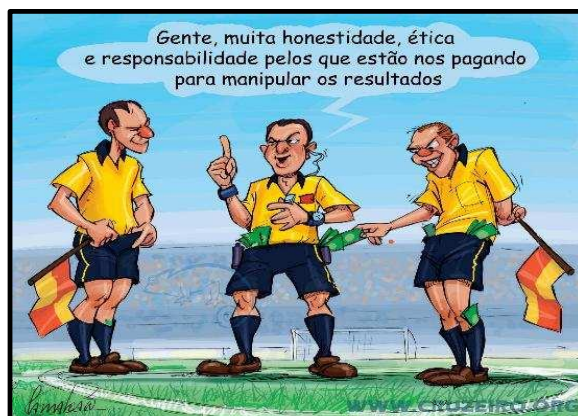
Figura 1 – arbitragem e corrupção

Também é comum encontrarmos desdobramentos de casos de suspeita de corrupção ou manipulação de resultados relacionados à competições amadoras, como o ocorrido em Matinhos no ano 2000, na Copa Mariner 4 envolvendo as equipes “Supermercado Brasão” e “Pague Menos Nativos”. Essa última impetrou um mandado de segurança para paralisar a competição devido a discordar dos motivos da sua desclassificação. Independentemente do fato ocorrido, destacamos a fala do dirigente da equipe “Supermercado Brasão” afirmando que não houve manipulação de resultado na partida: “Respeitosamente estamos comunicando que não houve acerto ou acordo no resultado final da partida de 4 x 4 [...]” (LIMA, 2000, grifos nossos).