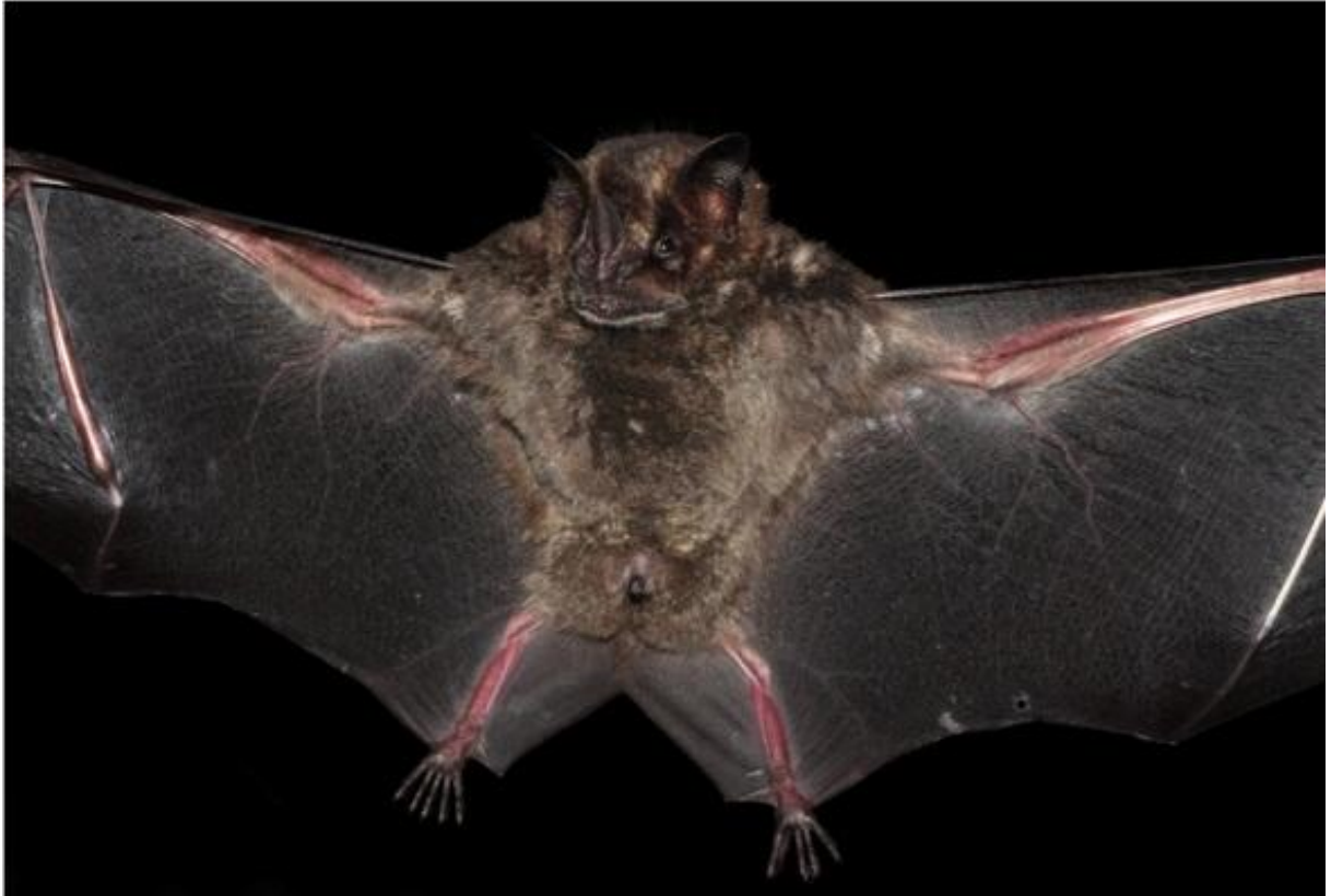
Figura 03. Imagem ilustrativa de Artibeus obscurus .

geralmente pouco evidentes ou indistinguíveis. Apêndice nasal com a margem inferior livre. Trago de cor marrom sem entalhes na borda externa (Figura 03).