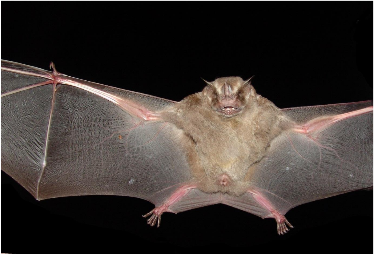
Figura 04. Imagem ilustrativa de Artibeus planirostris . Fonte: Fernando Carvalho.