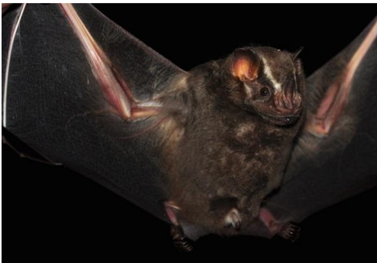
Figura 02. Imagem ilustrativa de Artibeus lituratus .

pelagem variando de marrom claro a marrom achocolatado mais escuro dorsalmente. Coloração dos pêlos da região ventral unicoloridos, geralmente da mesma cor que o dorso, podendo ser levemente mais clara. Listras faciais bem evidentes e com antebraço, membrana interfemural e as pernas hirsutas dorsalmente. Apêndice nasal com a base fusionada no meio do lábio superior. Trago amarelado com pequenos entalhes na borda externa (Figura 02).