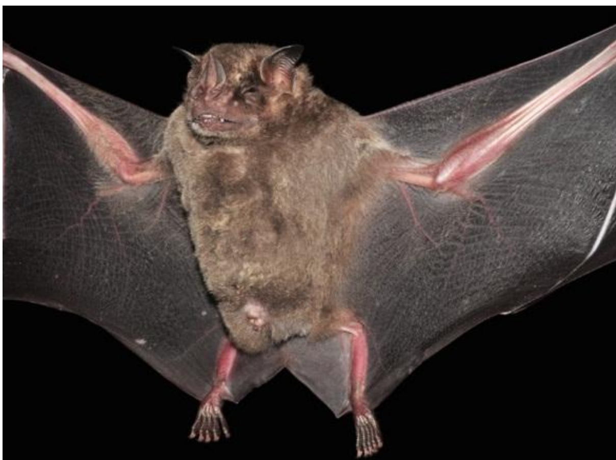
Figura 01. Imagem ilustrativa de Artibeus fimbriatus .

grande parte da sua distribuição com as outras três espécies do gênero (TADDEI et al. , 1998). Araújo e Langguth (2010) na última revisão do grupo descreveram as seguintes características para a espécie: grande porte, pelagem dorsal variando de marrom acinzentado à marrom escuro acinzentado, mais claro na região ventral, com a parte distal dos pêlos esbranquiçados. Dorso do antebraço, pernas e uropatágio com poucos e esparsos pêlos longos. Listras faciais variando de evidentes a pouco evidentes. Apêndice nasal com base fusionada, na parte média, à margem superior do lábio. Trago marrom sem entalhes na borda externa (Figura 01).