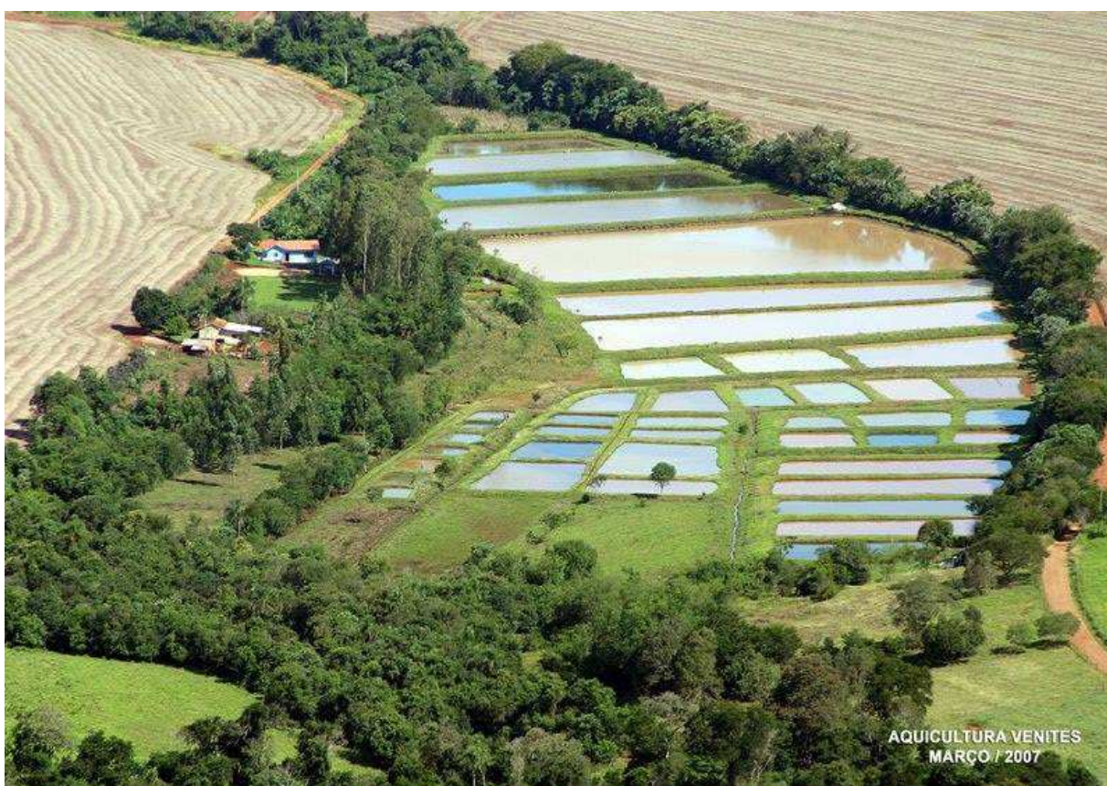
Figura 1. Vista superior da área da Aquicultura Venites.