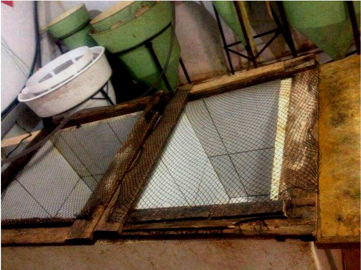
Figura 6. Tanques para reprodução e ao fundo incubadoras.

Já na reprodução do lambari é um pouco diferente são selecionadas as matrizes, estas são levadas para o laboratório do mesmo modo mais a quantidade de hormônio é diferente, pois, não é mais feito o cálculo por peso e sim por quantidade de peixes, ou seja, é aplicada uma única dose, com 2mg de hipófise a cada 20 peixes sendo fêmeas e 2 mg para cada 40 machos são alocados nos aquários juntos na proporção de 1 para 1 a reprodução acontece naturalmente após 6 a 8 horas aonde os ovócitos são liberados e fertilizados pelos machos no próprio aquário e depois é feita a coleta por meio de uma mangueira e bacia para receber os ovos que são sifonados do aquário e logo após são acondicionados às incubadoras, ai levando de 2 a 3 dias e chegando a este estágio de desenvolvimento as larvas foram transferidas para o respectivo tanque escavado onde foi jogado adubo para que estimulasse a produção de fitoplâncton para que estes servissem de alimentos para as larvas, a partir daí ocorre o desenvolvimento durante 28 e 30 dias para poderem ser comercializadas.