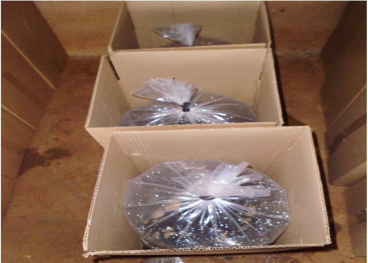
Figura 8. Peixes embalados e prontos para entrega.