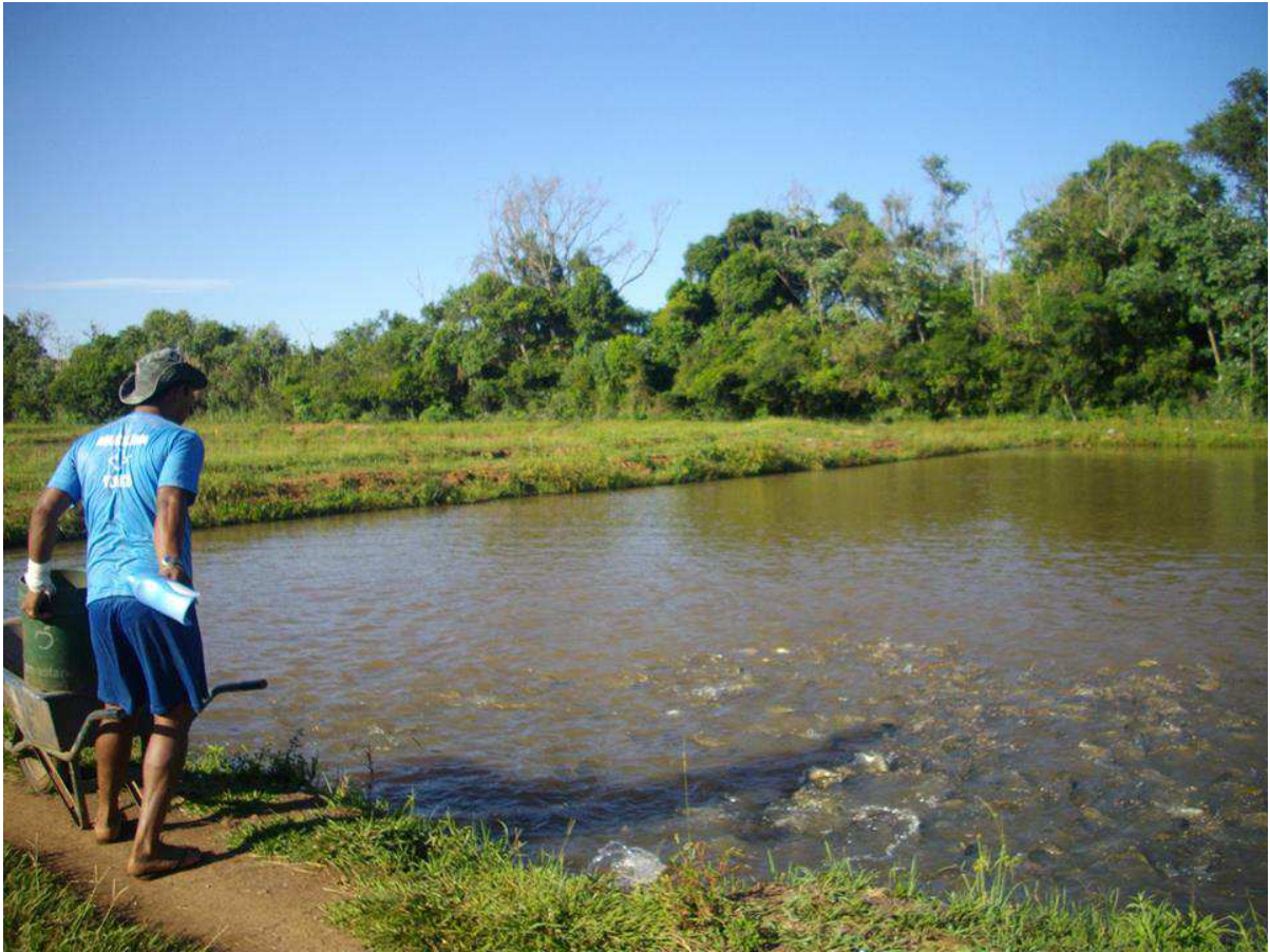
Figura 3. Alimentação de matrizes de tilápia.