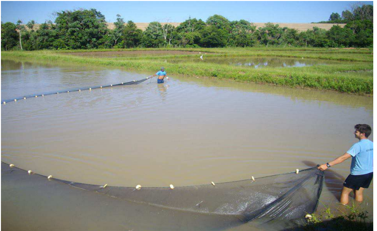
Figura 7. Coleta de alevinos para comercialização.

mangueira furadas a laser aumentando assim a quantidade de oxigênio injetada na água, as caixas tem dimensão de 400 a 1000 litros de água, a contagem era feita através de amostragem por peneiras ou por peso dependendo o tamanho do alevino, por isso é inquestionável a classificação, pois isso dá à certeza que os peixes estão em um lote uniforme a probabilidade de erro é muito pequena. O custo por tonelada de peixes transportada pode ser reduzido utilizando-se estratégias adequadas que permitam o transporte de uma grande carga de peixes em volumes mínimos de água.