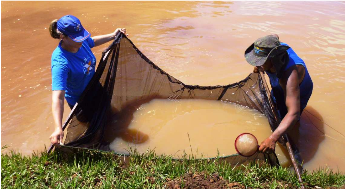
Figura 4. Coleta de nuvens.