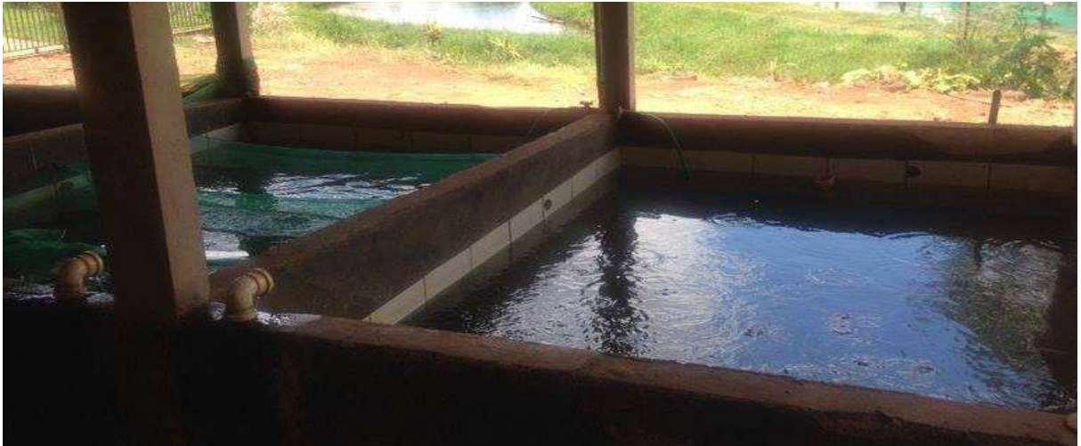
Figura 2. Tanques aonde são alocados alevinos para depuração.