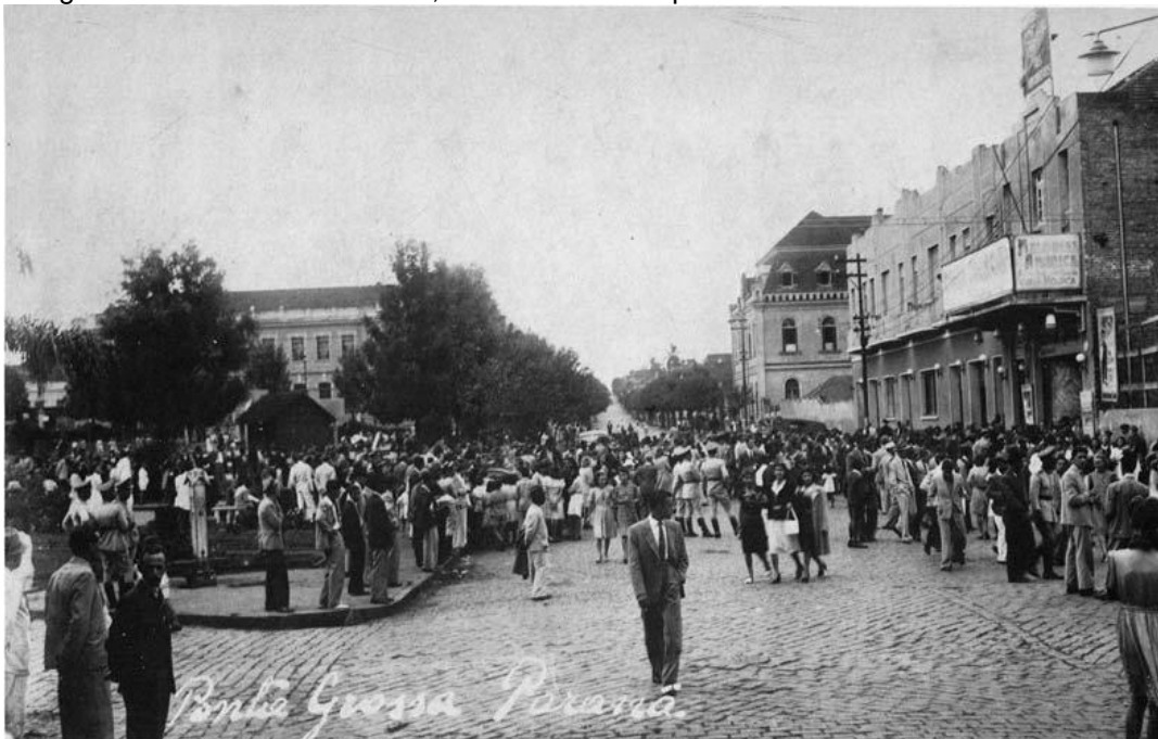
Fotografia 1- Rua Bonifácio Vilela, Saída do Cine Império-Década de 1940