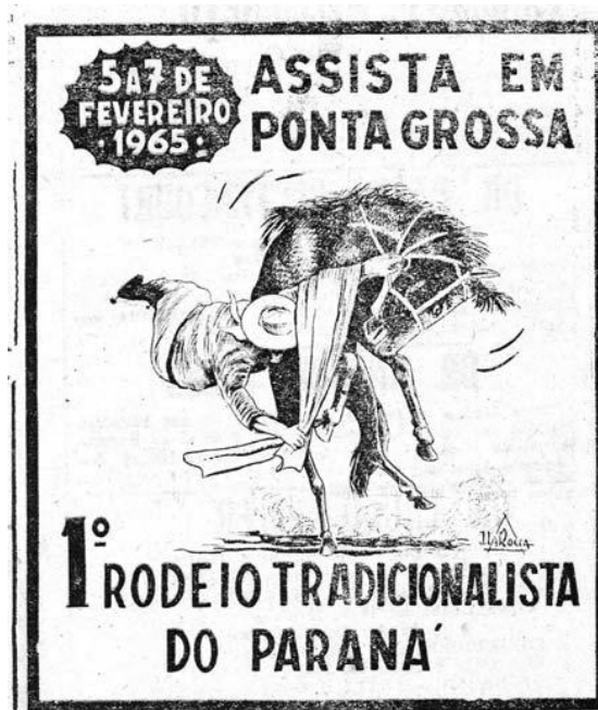
Ilustração 1 - Folheto de divulgação do I rodeio do CTG Vila Velha

Portanto, na presença de expectadores, no galpão que propositadamente foi planejado para aparentar uma construção rústica e simples, disputaram-se concursos de dança, de declamação, chula e acordeon. Era a face artística do rodeio, que contou ainda com o disputa entre grupos folclóricos que vieram de Curitiba e de algumas cidades do Rio Grande do Sul. 146 É válido pensar que o convite para que outros CTGs tomassem parte nessa festividade tinha por objetivo tornar o Vila Velha conhecido também em outras regiões. Por outro lado, isso também ajudaria seus membros na busca por prestígio e poder perante a sociedade local, posto que, nas disputas realizadas durante o rodeio, seriam seus representantes.