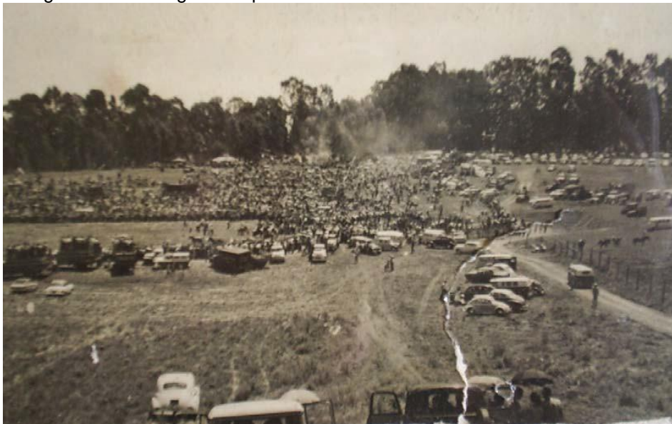
Fotografia 2 - Visão geral do primeiro rodeio tradicionalista do Paraná – 1965