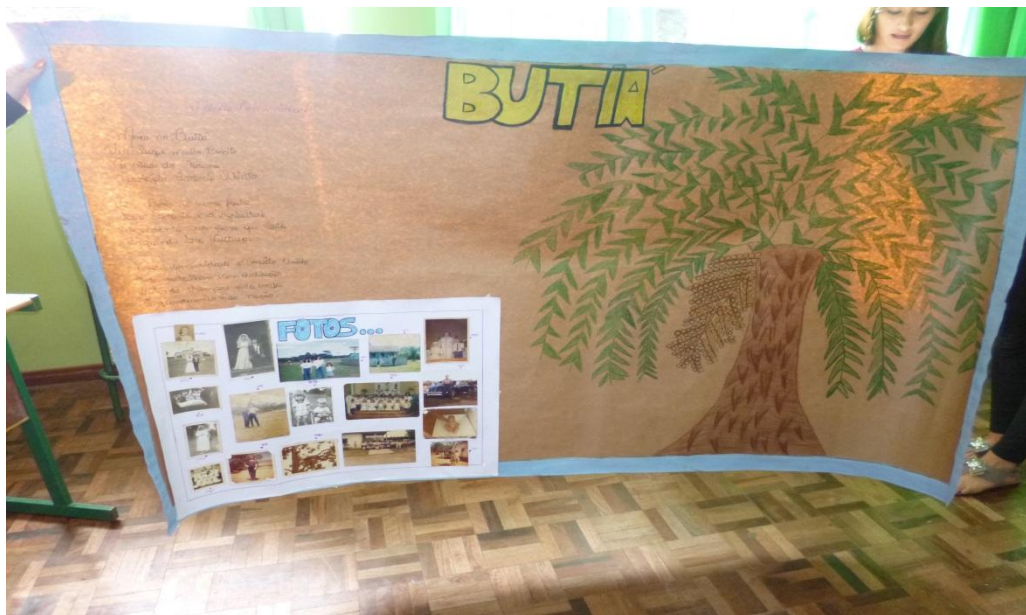
Cartaz de fotos trazidas por alunos da comunidade de Butiá - Antonio Olinto-PR

Além disso, analisaram a linguagem utilizada com os familiares e vizinhos, e concluíram que predomina a linguagem coloquial, onde ocorre muitas vezes um vocabulário que passa a não ser compreendido em outras situações mais formais, deixando seus usuários constrangidos e mal interpretados. Foram muitas as exemplificações de situações em que seus familiares se sentiram inferiorizados devido a linguagem utilizada; "Faiz favor de tirá um xerox pra mim, são três foias", ao entrar em uma papelaria e solicitar três cópias de um documento." Por exemplo "bassorra" é o termo utilizado para designar "vassoura", "tchamanhã" para "até amanhã".