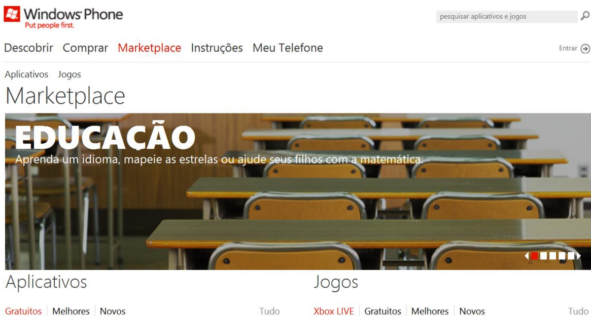
Figura 1. Marketplace Windows Phone. Catura da imagem Marketplace, loja Windows Phone com Aplicativos e Jogos disponíveis para área da Educação

Os aplicativos educacionais para crianças ainda é um mercado pouco explorado, apesar dos altos investimentos do mercado, somente 2% dos aplicativos são enquadrados na área de Educação, apresentando uma oportunidade para os produtos de alta qualidade, que podem ser divertidos e ao mesmo tempo educativos. Shuler (2009) afirma que 47% dos 100 melhores aplicativos vendidos têm foco na educação de crianças, assim o mercado para aplicativos educativos para crianças deve ser considerado um passo importante. Investimentos em lojas como Marketplace do Windows Phone (Figura 1) facilitam a distribuição de aplicativos, onde 50% são baixados gratuitamente (Windows Phone, 2011).