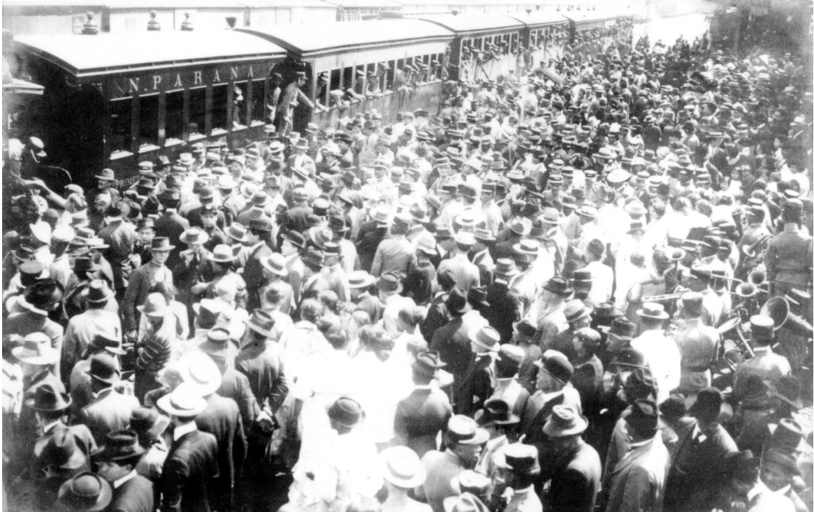
Autor não identificado. Soldados já embarcados no trem para as últimas despedidas. 1912. 1 fot.: p & b.

Diversas imagens foram produzidas mostrando o caminho percorrido pelos militares. Na última fotografia tirada de João Gualberto, a tropa partia de Porto União em direção a Palmas. É interessante observar a indumentária usada pelo grupo onde aparece, por exemplo, um soldado carregando um instrumento de sopro, responsável pelo anúncio da passagem dos militares, bem como os olhos atentos da população, a observar o desfile da tropa.