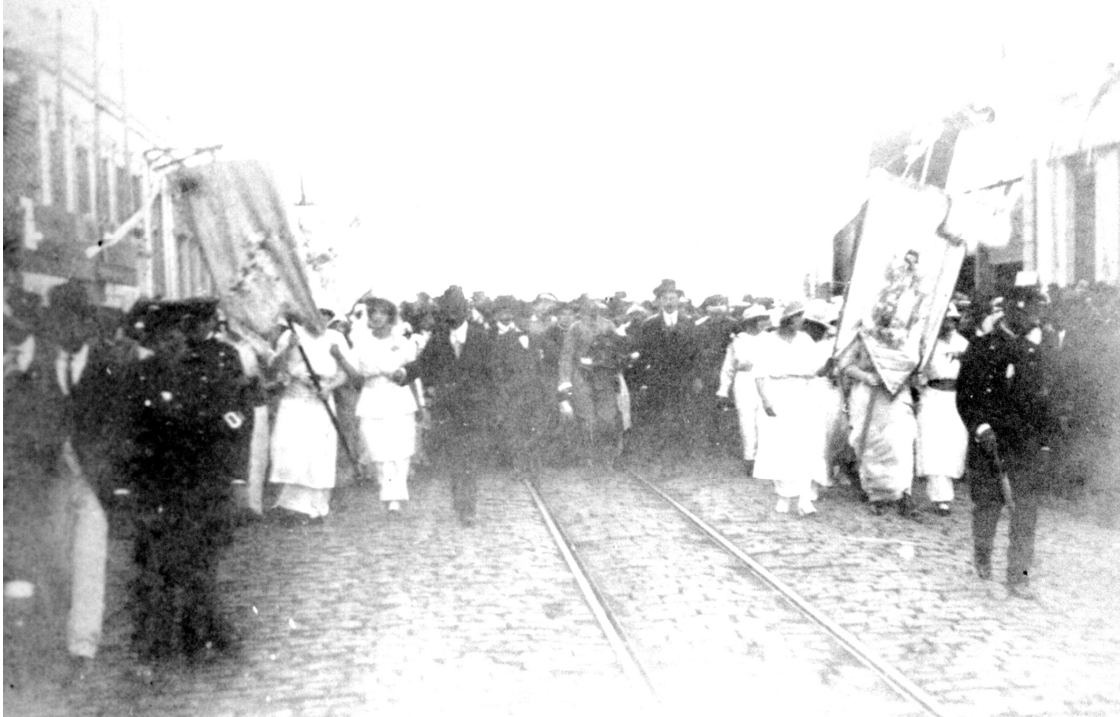
Autor não identificado. Recepção ao General Setembrino de Carvalho. 1914. 1 fot.: p & b. Acervo da Casa da Memória, Curitiba.

A preocupação com a consolidação da identidade nacional não esteve presente somente na forma como a sociedade conduziu a luta contra os sertanejos . Nos relatos militares, essa questão constituiu um dos pontos centrais.