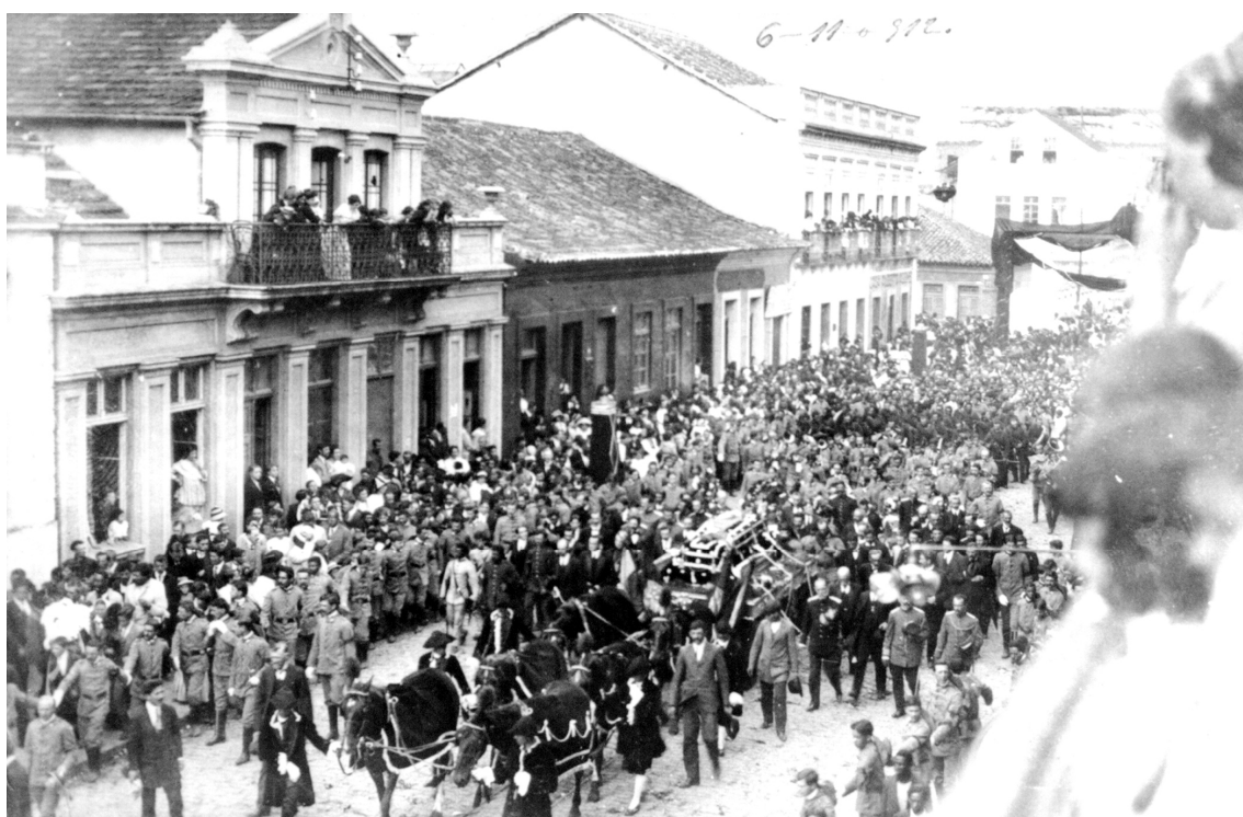
Funeral de João Gualberto. 1912. Coleção de postais Júlia Wanderley. 1 fot.: p & b.

A atribuição de heroísmo a João Gualberto, a dramatização em torno de sua morte esteve presente nas notícias desde o combate do Irani, até o dia em que o seu corpo chegou em Curitiba para ser velado e recebido em cortejo fúnebre. Neste momento, a morte realmente se tornou uma festa. Foi criado todo um aparato para o recebimento do corpo. O clima de comoção emitido pelo Diário da Tarde com a chegada do militar morto pelos sertanejos foi enorme. Em suas páginas, foram reportados aspectos da biografia do morto, lembrando seus principais feitos enquanto vivo. Nas ruas da cidade diversos recursos foram utilizados para homenageá-lo. A teatralização da morte foi posta em cena. Para que a platéia pudesse contemplá-la, o itinerário do cortejo fúnebre percorreu as principais ruas da capital.